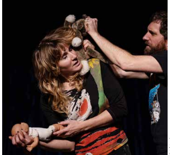
🕒 Jongen (23/9)