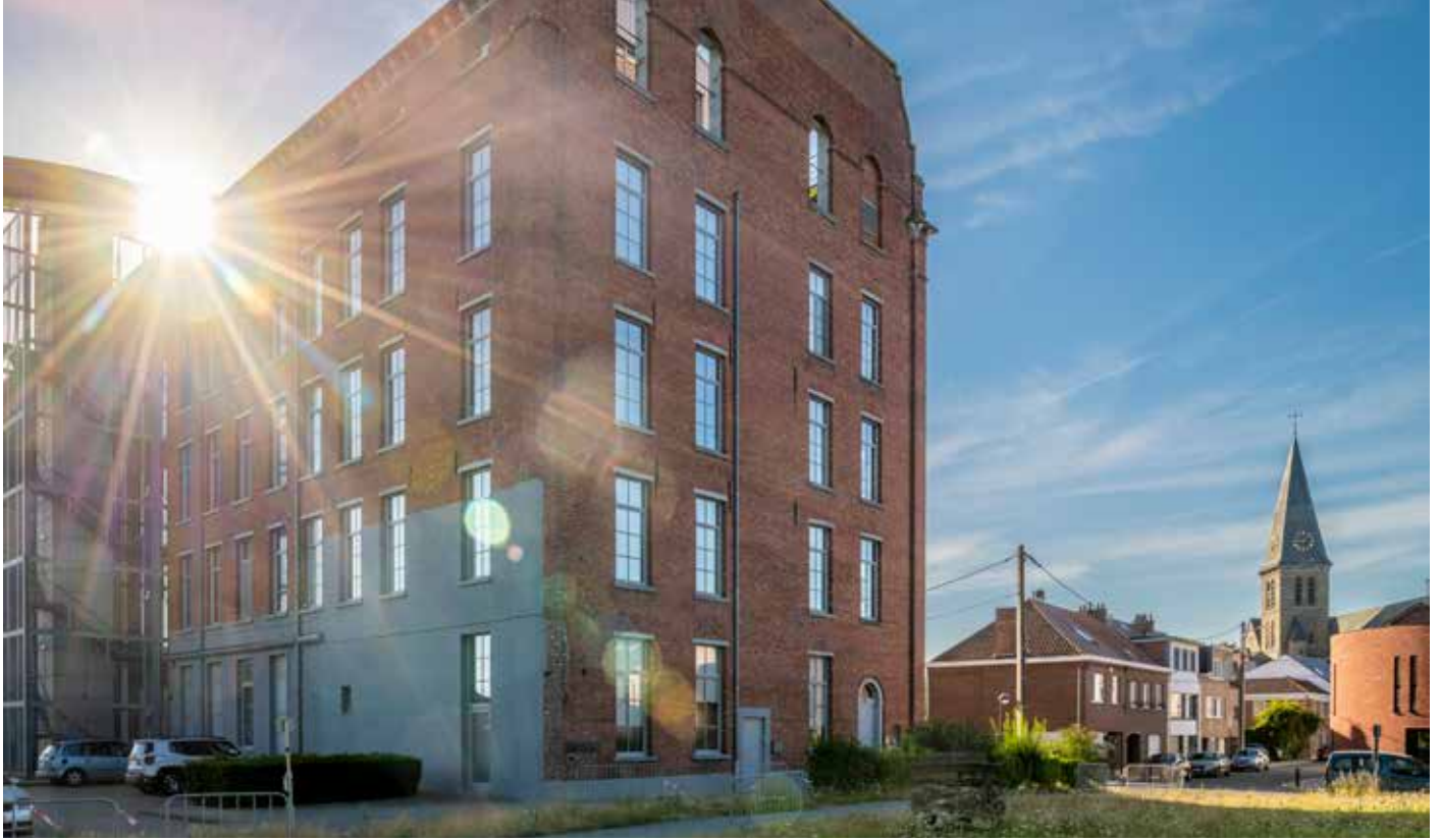
① Textielabriek Scheppers (Lot)

op. Scheppers bouwde een fabriek met voor die tijd vooruitstrevende maatregelen die het comfort, de veiligheid en de gezondheid van de werkkrachten ten goede kwamen. Het magazijn had grote vensters die het daglicht binnen lieten. Er waren verhoogde daken in de ververij om de giftige dampen te laten ontsnappen. In 1863 richtte Scheppers een Nederlandstalige school op voor arbeiderskinderen in Dworp en een Franstalige school in Sint-Pieters-Leeuw, elk goed voor zo'n 75 leerlingen. Vanaf 1872 was er ook een meisjesschool en een bewaarschool verbonden aan de fabriek, uitgebaat door de zusters van de Voorzienigheid van Gosselies, waar zo'n 140 kinderen tot 7 jaar werden opgevangen. Er waren uitgaven voor de vergoedingen van schoolmeesters en de pastoor. Eendracht Maakt Macht, de fanfare in Lot, opgericht in 1875, heeft steeds een nauwe band gehad met de fabriek. Repetities vonden tot in 1889 in de fabrieksgebouwen plaats.