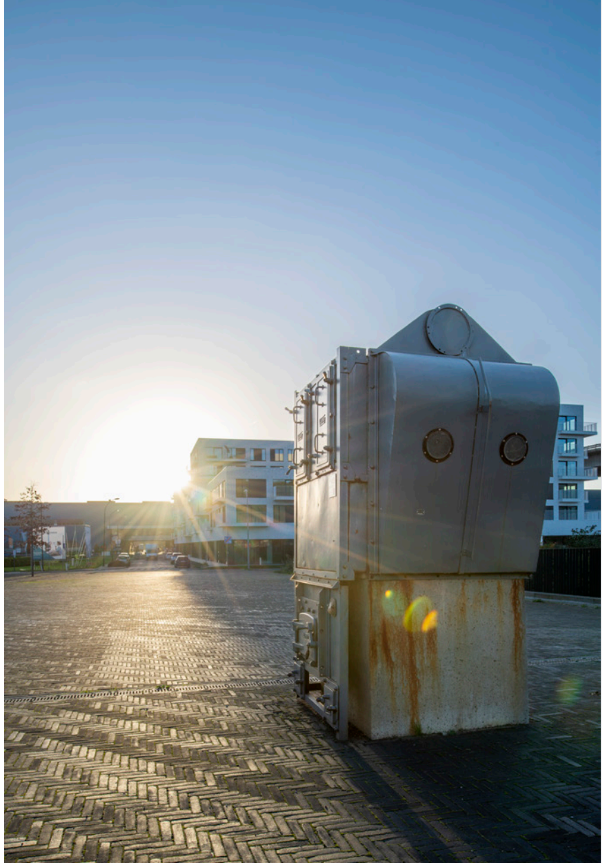
📍 Broekplein (Vilvoorde)

Museum van de Molen en de Voeding in een oude windmolen in Evere ook de moeite waard. Het is onterecht een minder bekend pareltje waar je sinds 2008 kunt zien hoe het produceren van voedsel van een zuivere landbouwbouwactiviteit op kleine schaal uitgroeide tot een machinaal industrieel proces. In 1853 werd de graanmolen vlakbij de Haachtsesteenweg aangesloten op een stoommachine, waardoor ook de locatie onderwerp is van de evolutie van ambacht naar industrie. Net voor de Eerste Wereldoorlog kon de kleine molen echter niet meer opboksen tegen de grote maalderijen. De molen verloor zijn maalfunctie en kende tal van andere bestemmingen tot het een museum werd. Nog tot volgende zomer kun je de tentoonstelling Food and the city bezoeken. De expo schetst een beeld van de historische evolutie van de voedselvoorziening van steden en werpt een blik op de hedendaagse uitdagingen om een stad te voeden. Toepasselijk en herkenbaar voor de Rand die, al honderden jaren voor voeding en tal van andere producten, toeleverancier is voor de hoofdstad. ●