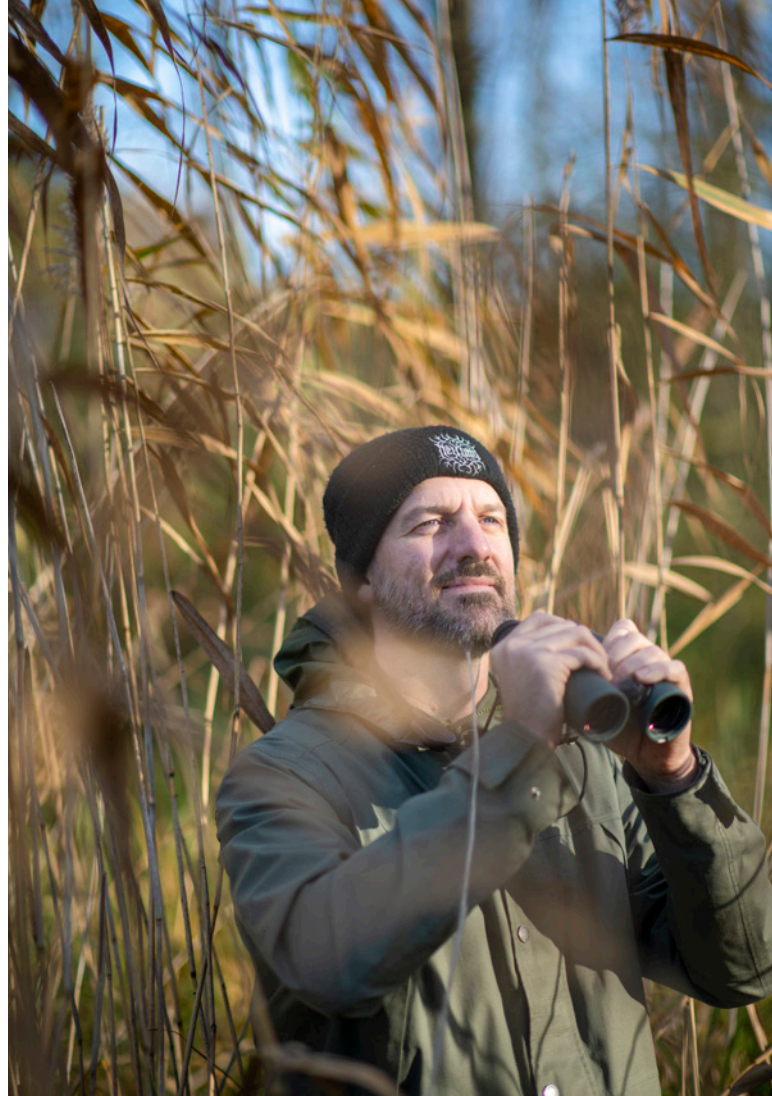
📍 Begijn Le Bleu

TEKST Michaël Bellon