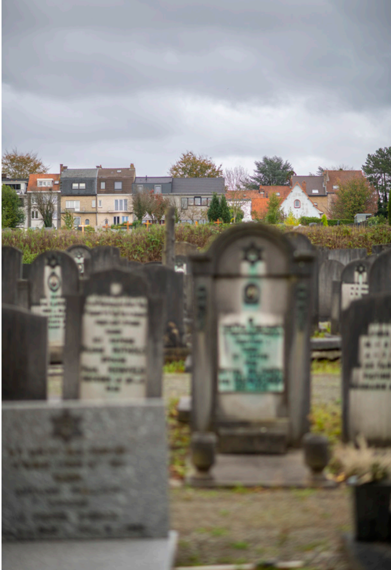
📍 begraafplaats Dilbeek

In het liberale België was er ruimte voor een joodse gemeenschap die de aard van de staat mee in de verf zette. In 1889 schilderde Eduard Brandon een doek dat zich in de grote synagoge afspeelt. De menora , de zevenarmige kandelaar, is prominent aanwezig. Aan weerskanten van de synagoge houden mannen keurig uitgedost en met buishoed, en jongens in het zwart, de blik op de lezenaar gericht. Het gebouw zit vol. De sfeer is plechtig en ernstig. De titel van het werk luidt Gebeden voor Leopold II, Koning der Belgen, in de synagoge . De joodse gemeenschap staat met volle overtuiging ten dienste van koning en staat, vertelt het werk ons. De gemeenschap stelt niet alleen zichzelf voor, maar ze neemt een publieke plek in, in het hart van de stad en op de plaats van de macht.