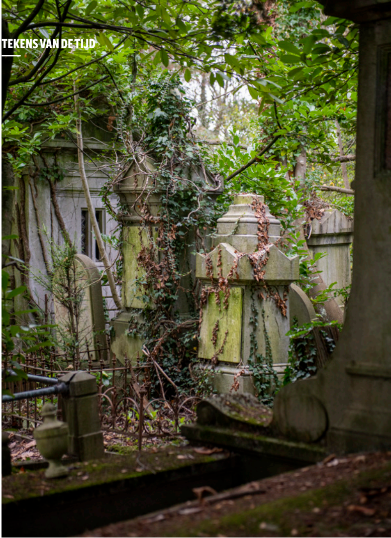
Ⓜ begraafplaats Ukkel

ongemerkt in elkaar over, maar scheidde het joodse perceel zich subtiel af van de andere perken. De joodse gemeenschap assimileerde niet meer zoals in Ukkel, maar ze werd een eigen gemeenschap. Ook de wijzigende verhoudingen in de gemeenschap komen scherper naar voor. Naast plaatselijke namen als Brilleslyper of Lelyveld en Van Straten in Ukkel, valt het grote aantal Duitse en Oost-Europese namen op. Zo helt het zwaartepunt van de joodse gemeenschap stilaan over naar het oosten. Weliswaar zijn de kleine en grote graven met hun arduinen zerken en bronzen belettering nog gelijkend met niet-joodse graven, maar het toevallige verdwalen zit er niet meer in. Herzls roep naar eigen identiteit komt in stilte dichterbij.