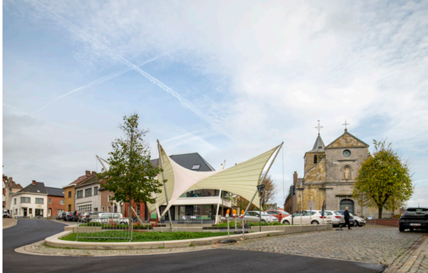
📍 dorpskern Gooik

De gemeente Merchtem wil 7 ha bos aanplanten op de Hoge Wei. Vanaf 1770 heeft daar nooit een bos gestaan. Het gaat om historische graslanden die wettelijk beschermd zijn. Maar de druk om die 4.000 ha bos te realiseren, is immens. En zo vervangen we waardevolle biotopen door een minderwaardige bomenverzameling die zelfs binnen honderd jaar nog geen bos zal zijn. Ook daar komt er een speelbos te midden van overstromingsgebied. Dat levert enkel verliezers op: er komt geen volwaardig bos, de precare graslandbiotoop gaat verloren en de eeuwenoude historisch-culturele waarde verdwijnt. Meer bossen aanleggen, is zeker een goed idee; wel is het voor een goed ecosysteem raadzaam om goed na te denken over waar die bomen worden aangeplant. •