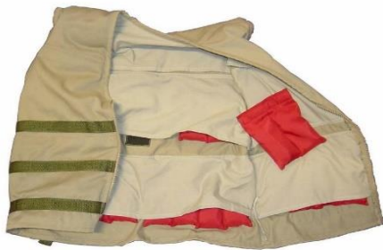
2 Een verzwaard vest - © Atelier Michel Koene

Een verzwaard vest pomp je op met een handpompje. Het geeft je een aangenaam gevoel van druk. Diepe druk helpt met omgaan met stress, angst en overprikkeling. De vesten hebben een licht gewicht en zijn dun. Je draagt ze onder je eigen kleding of in een bijpassend jasje.