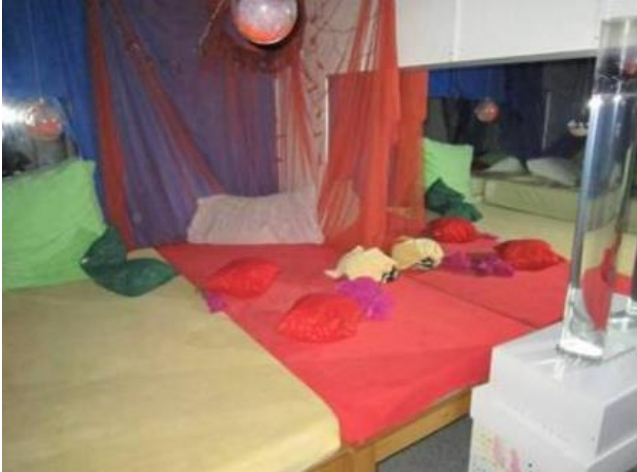
11 Snoezelruimte in zorgcentrum Maria Ter Engelen vzw

Buiten spelen of tijd doorbrengen in de tuin kan als er een stevige en veilige omheining is zodat je niet zomaar kan weglopen.