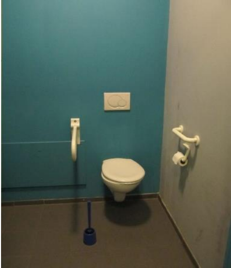
9 Toiletruimte met contrasterende kleuren in jeugdverblijf FOS De Toekan

Voor meer rust tijdens het eten kan je kiezen om een deel van de eetruimte visueel of akoestisch af te schermen . Zo eet je er met weinig prikkels.