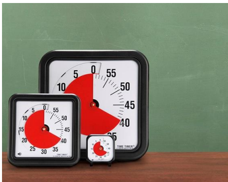
7 Een tijdsaanduider - © Time Timer

Niet iedereen heeft een even goed begrip van tijd of vindt het makkelijk om de tijd in het oog te houden. Maar voor meer zelfstandigheid is leren omgaan met tijd belangrijk. Je moet bijvoorbeeld weten hoe lang iets duurt. Een tijdsaanduider helpt daarbij, zeker als je geen klok kan lezen. Je stelt een bepaalde tijd in door een rode schijf te verschuiven. Die verdwijnt naarmate de tijd voorbij gaat. Zo zie je hoeveel tijd er al om is en hoeveel er nog over blijft. Ook voor smartphones bestaan er tijdsaanduiderapps, zoals Time Timer.