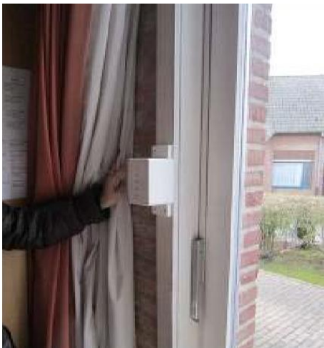
8 Raambeveiliging in zorgcentrum Maria - Ter - Engelen vzw

Beveilig onderdelen van de woning die een gevaar zijn voor de veiligheid. Sluit bijvoorbeeld ramen af met sloten en plaats elektriciteitsbediening niet in maar buiten de slaapkamer. Of installeer rolluiken met een bediening waaraan je niet zomaar kan. Voor mensen die met deuren slaan, kan je de deuren verstevigen met aangepast hang- en sluitwerk .