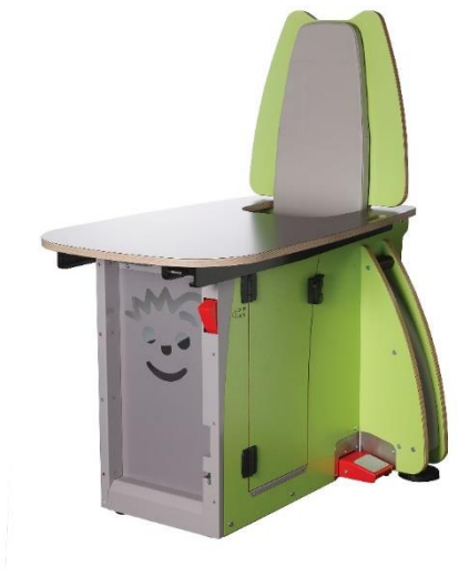
3 - Een blijfstoel - © Yacura

De blijfstoel is een verrijdbaar zithuisje voor kinderen die onrustig zijn en veel bewegen. En dat zonder hun bewegingsvrijheid te ontnemen. Dit eenvoudig ontwerp is een originele oplossing met rust en gebruiksgemak voor kind en zorgverlener.