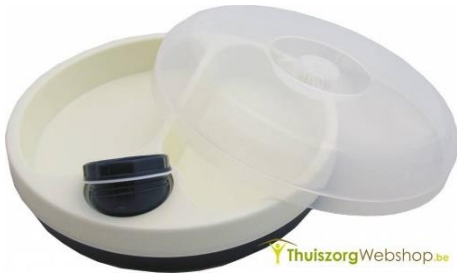
5 Een warmhoudbord

Sommige mensen spelen graag met de knoppen van het fornuis. Om vergassing of brand te vermijden, beveilig je ze met een beveiligingssysteem voor de bedieningsknoppen .