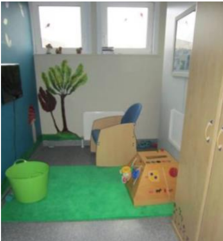
10 Speelruimte in zorgcentrum Maria Ter Engelen vzw

Een aparte ruimte om te snoezelen en te spelen helpt om veilig de dag door te brengen. Ook hier kan het nodig zijn om die ruimte extra duurzaam en veilig te maken met aangepaste materialen en bepolstering en de deuren te verstevigen met aangepast hang- en sluitwerk .