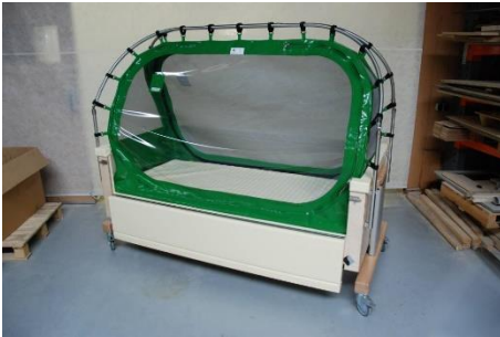
1 Een tentbed

Een tentbed heeft een zachte bovenbouw. Het is daarom heel geschikt voor mensen die zich kunnen verwonden in een gewoon bed. Je kan het volledig dichtritsen. Daardoor is de kans dat je valt zonder toezicht heel wat kleiner.