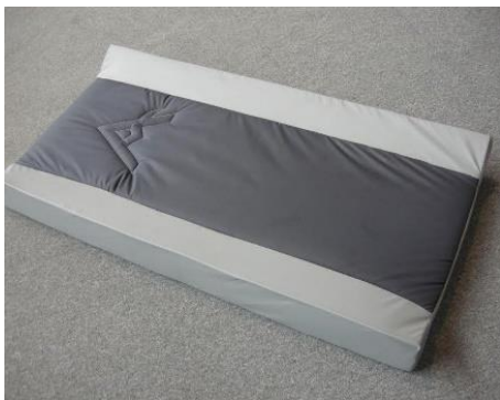
4 Een verzorgingskussen voor volwassenen

Gewone verzorgingskussens zijn meestal niet groot genoeg om grotere kinderen, jongeren of volwassenen te verzorgen. Met een verzorgingskussen met de grootte van een eenpersoonsbed heb je genoeg zorgruimte. Dat moet afwasbaar zijn en stevig genoeg.