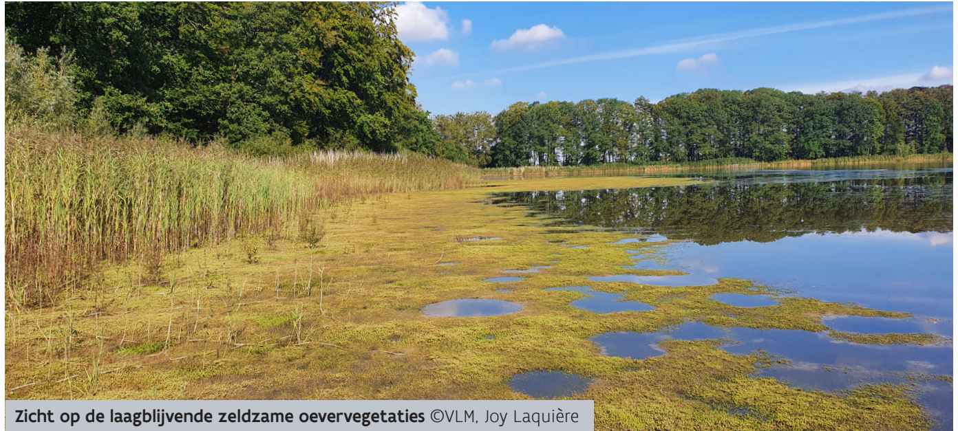
Zicht op de laagblijvende zeldzame oevervegetaties

Er zal een voorzuivering van de Bloembeek gebeuren op het perceel ten zuidoosten van de Kraenepoel met bufferbekkens en een ijzerzandfilter. De nodige aanpassingen aan de grachten langsheen de E40 zullen de noodzakelijke watertoevoer verzekeren. Een voorbeeld van een ijzerzandfilter zie je op de foto hiernaast.