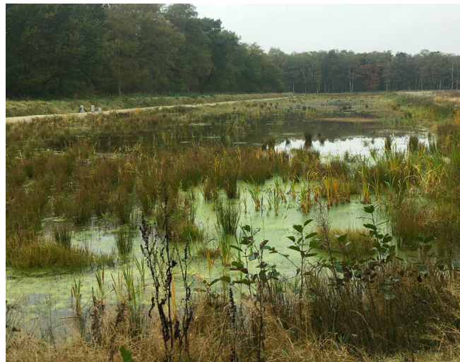
Grote filter van ijzerzand zuivert watertoevoer naar Brabants ven (De Groote Meer in West-Brabant).