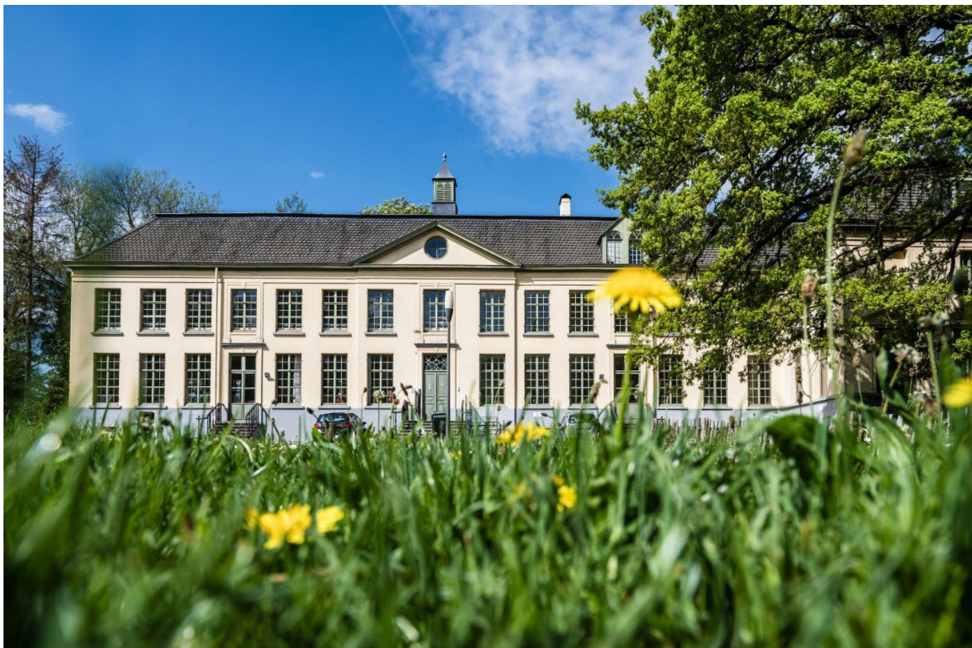
De Campagne