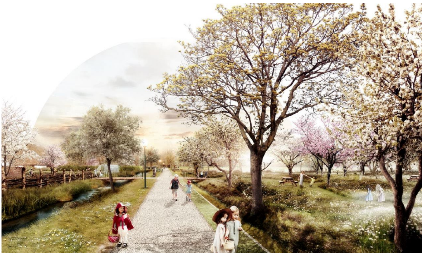
toekomstbeeld Portaal De Campagne