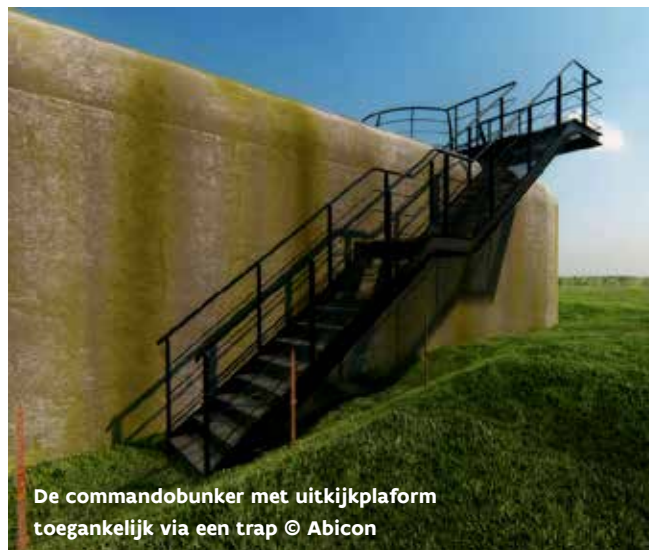
De commandobunker met uitkijkplatform toegankelijk via een trap

Hekken in de deurgaten zullen vandalisme in de bunkers tegengaan. Kleine herstelwerken aan de bunkers zullen dit beschermde monument behoeden van verder verval. Om schuilgelegenheid te geven aan vleermuizen en amfibieën wordt één bunker ingericht met o.a. een deur met invlieg- en kruipopening.