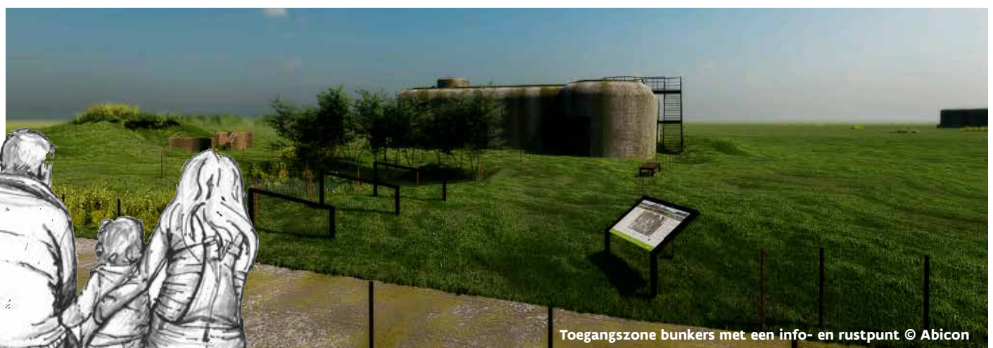
Toegangszone bunkers met een info- en rustpunt

Voor deze werken kan het natuurinrichtingsproject genieten van Europese subsidiëring via het Interregproject VEDETTE (Europees Fonds voor Regionale Ontwikkeling).