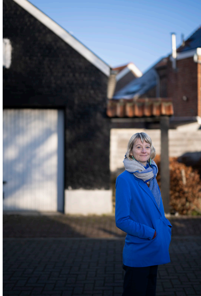
📍 Tine Hens

TEKST Michaël Bellon