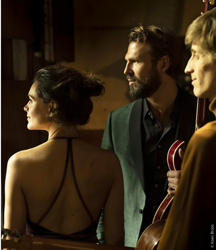
● La Serenata (2/3, 3/3, 29/3 en 31/3)