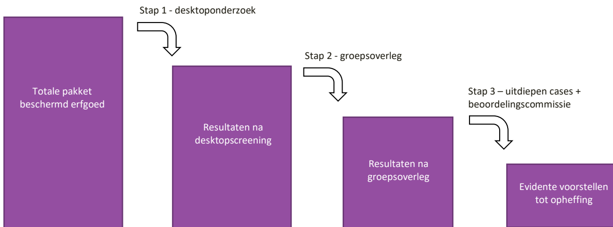
Figuur 1 - Schematische weergave van de methodologie

Gezien de beperkte tijd waarin het onderzoek plaatsvond, verliep de snelle screening in verschillende fases. Deze methode vertrok van het volledige beschermde bestand en bakende door twee eliminatiefases een behapbaar pakket af dat in een derde fase grondiger onderzocht werd. Na de derde fase hielden we een lijst over van beschermingen waarvan het evident is dat ze vandaag niet meer voldoen aan de huidige selectiecriteria voor aanduiding als beschermd erfgoed.