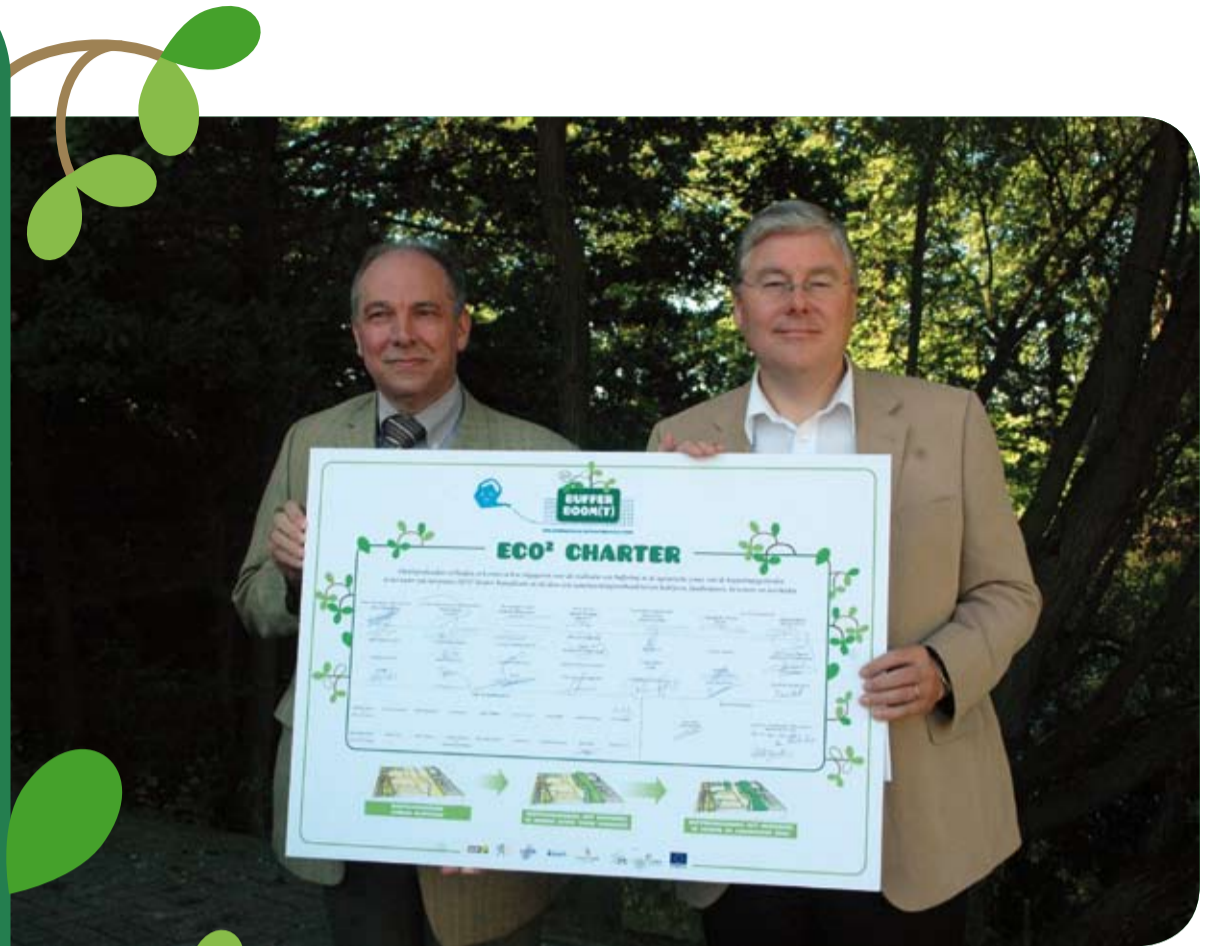
Gouden peters 'Stora Enso' en 'ArcelorMittal'

'ArcelorMittal investeert al jaar en dag in groenbuffers op onze eigen terreinen. Ook in dit project kiezen we voluit voor de zorg om het landschap. We doen dit niet alleen om de hinder die onze activiteiten kunnen veroorzaken, te milderen. We werken ook graag aan een aangename woon- en werkomgeving. Het bijzondere aan dit project? Er zijn geen verliezers. Iedereen wint! Landbouwers krijgen een correcte vergoeding – ze investeren toch grond, tijd en arbeid –, omwonenden en fietsers een kwaliteitsvolle leefomgeving en wij, bedrijven, een goede relatie met de buurt. Bovendien gebeurt alles op vrijwillige basis. Er is geen sprake van gedwongen onteigeningen, conflicterende belangen... Kortom: landbouwers, omwonenden en bedrijven staan samen op één lijn.'