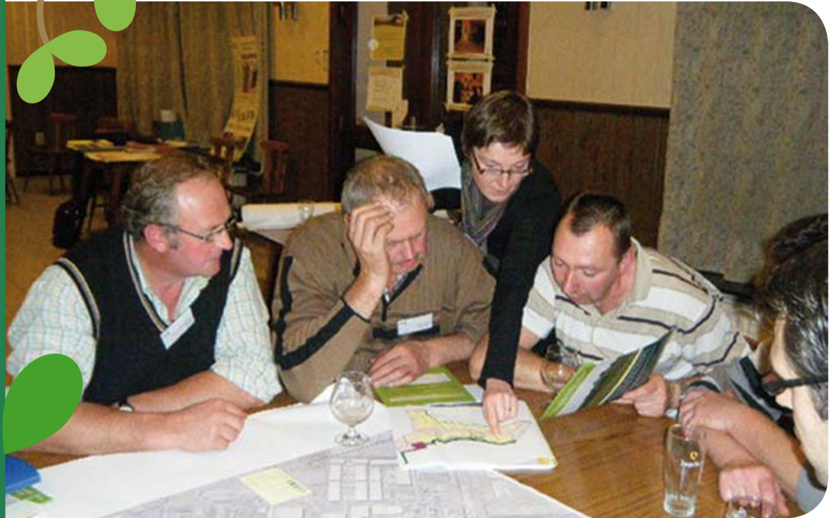
Landbouwers overleggen waar ze bomen kunnen planten

'Waarom we meestappen in dit project? Voor het uitzicht natuurlijk. Een mooier landschap, daar geniet iedereen van. En dat komt dan weer het imago van de landbouw ten goede. De vergoeding die we krijgen voor de aanleg van de buffers is zeker mooi meegenomen. Maar daar tegenover staat dat we blijven instaan voor het onderhoud. Op onze percelen gaat het vooral om knotwilgen. Die moeten geregeld worden gesnoeid. Tegelijk bieden ze beschutting aan het vee op onze weiden. Dat is natuurlijk ook een voordeel.'