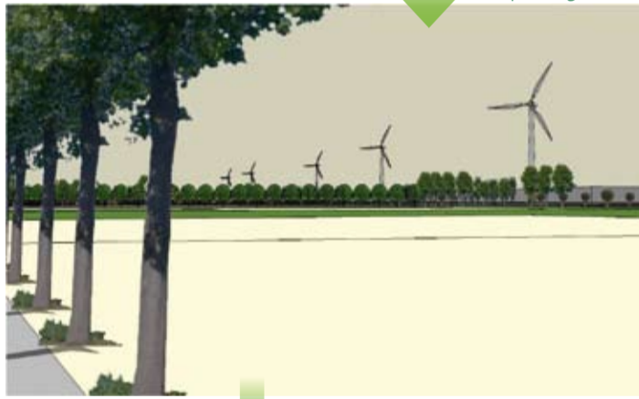
aanplantingen Vlaamse Overheid en ECO 2