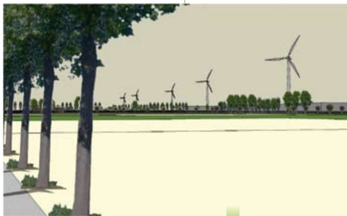
aanplantingen ECO 2