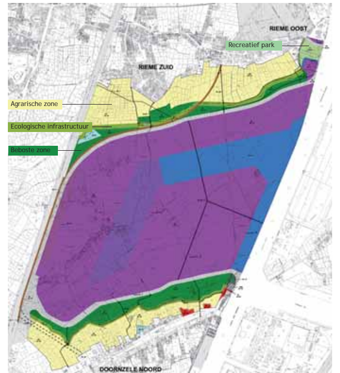
Achtergrond: Gescande kadastrale plans - Toestand 01/01/2002

Verdiene boeren evenveel met bomen planten als met maïs telen?