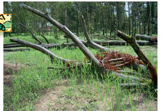
Natuurlijke speelelementen in de speelzone.

Ter hoogte van de gebiedstoegang 't Kalf werd een speelbos aangelegd. Het bos is meer open gemaakt en enkele heuvels en grote boomstammen vormen hier natuurlijke speelelementen. Met het achtergelaten sprokkelhout kan worden geravot en kunnen kampen worden gebouwd.