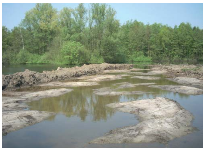
De plas-dras krijgt vorm.

De vroegere visvijver aan de E34 en de vijvers in het zuidoosten (aansluitend bij de speelzone) kregen samen met hun omgeving een grondige opknapbeurt. Het schiereiland werd afgegraven tot op plasdras niveau waardoor een waardevolle moeraszone meer natuurlijke variatie zal brengen. Plaatselijk werden ook enkele oevers zacht hellend gemaakt om een meer natuurlijke situatie te creëren.