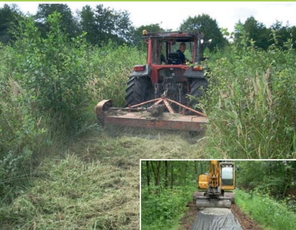
Het laarzenpad wordt gemaaid.