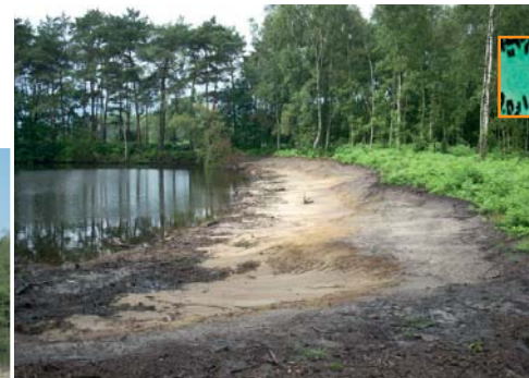
Meer natuurlijke oevers.