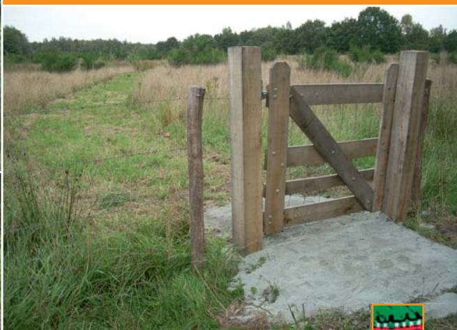
Zicht op het laarzenpad.