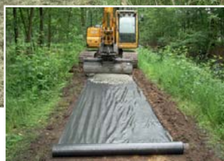
Geotextiel, een laag porfier en een laagje grond verbeteren de paden.