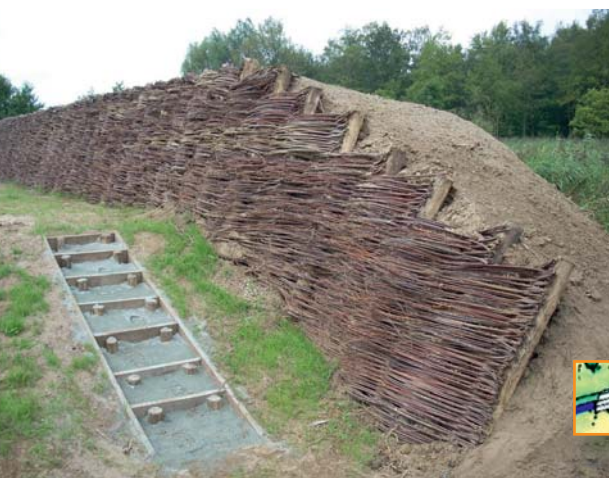
Visualisatie van de oude verdedigingswal.

Voor fietsers werd een verbinding gecreëerd tussen de spoorwegbedding en de Koestraat. Via de Braemstraat en de Koningstraat wordt de Klinge verbonden met de Stropersstraat. De Liniedreef is niet meer toegankelijk voor fietsers gezien de combinatie met het mindervalidenpad. Mountainbikers kunnen de voor hen uitgestippelde routes volgen. Ruiters kunnen het bos doorkruisen via de Braemstraat, de Stropersstraat en de St.-Pietersnieuwstraat.