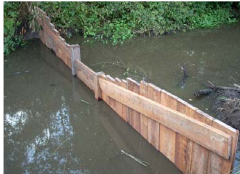
Vistrappen in opbouw.

Drie gebiedstoegangen vormen het startpunt voor verschillende wandeltochten. Naast de ingang Fort Sint-Jan werden twee kleinere toegangen ingericht ter hoogte van de Klinge en 't Kalf. De drie ingangen werden uitgerust met een fietsenstalling, een picknicktafel en infoborden, die net zoals op andere plaatsen in het bos, de recreant wegwijzen maken in het gebied.