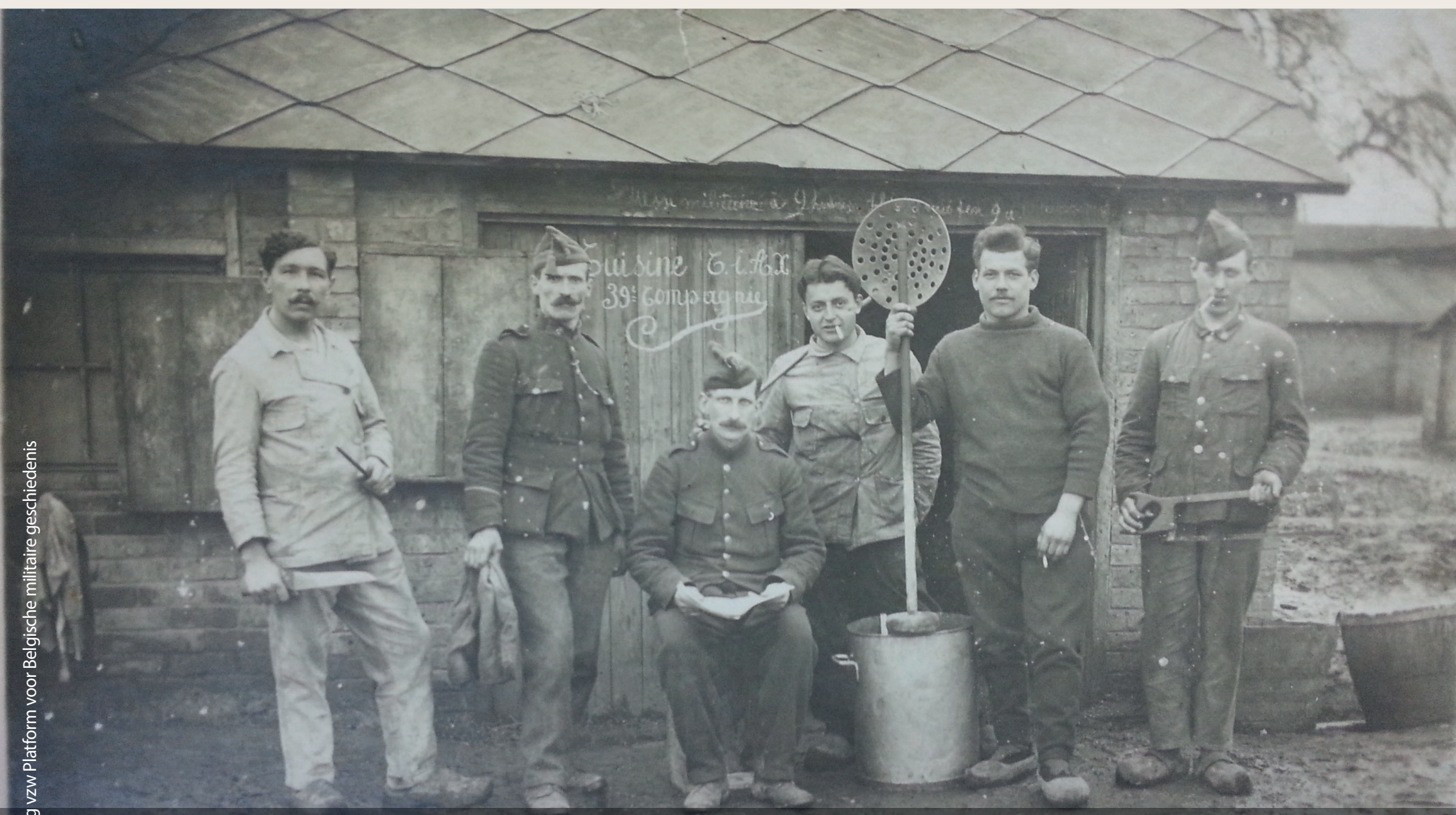
Militairen poseren voor een veldkeuken in een opleidingscentrum voor hulpstroepen (CIAX 39e compagnie) ergens in Frankrijk Soldiers pose in front of a field kitchen in a training centre for auxiliary troops (CIAX 39th squad) somewhere in France Des militaires posent devant une cuisine de compagnie dans un centre d'instruction pour troupes auxiliaires (CIAX 39e compagnie) quelque part en France Soldaten posieren vor einer Feldküche in einem Ausbildungszentrum für Hilfstruppen (CIAX 39. Kompanie) irgendwo in Frankreich

Die Feldküche wurde im Rahmen der Tauschparzellierung Sint-Rijkers Ende 2016 – Anfang 2017 restauriert und der Öffentlichkeit zugänglich gemacht. Der Stahlrahmen repräsentiert den verschwundenen Teil des Gebäudes. Die Stadt Lo-Reninge ist Eigentümer und Verwalter der Gedenkstätte.