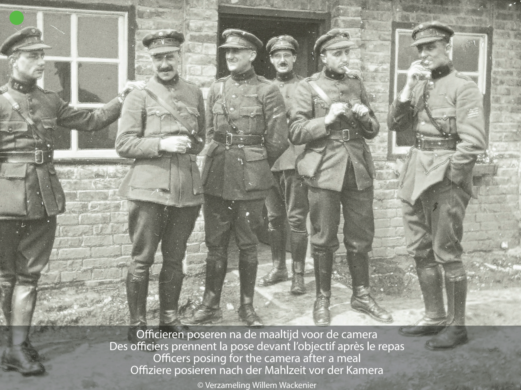
Officiers poseren na de maaltijd voor de camera Des officiers prennent la pose devant l'objectif après le repas Officers posing for the camera after a meal Offiziere posieren nach der Mahlzeit vor der Kamera