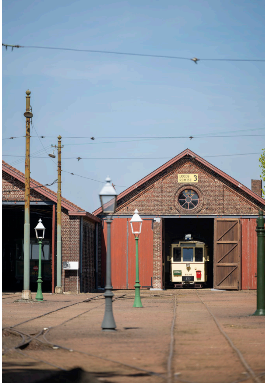
📍 Transsite in Schepdaal.

Vanaf dit kruispunt kun je ook naar Sint-Gertrudis-Pede, waar de prachtige watermolen de beekvallei siert. En ook vanaf