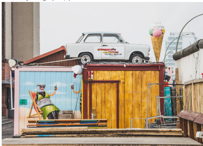
📍 Last Day of Magic (tot 5/6)

Bakole staat ons te woord in het Engels omdat ze nog wat timide is over haar Nederlands, ook al heeft ze een Vlaamse vriendin. Op een podium staat taal haar