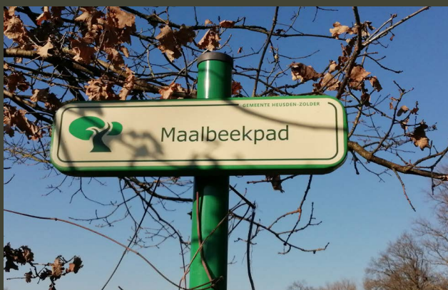
pad langs de Mangelbeek