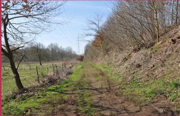
pad ten zuiden van 't Routeke

De voorbije jaren werkte de Vlaamse Landmaatschappij (VLM) samen met de gemeente Heusden-Zolder en andere partners een landinrichtingsplan uit om de kwaliteiten van de Mangelbeekvallei verder uit te bouwen. Samen met de buurt en partners willen we de verborgen en soms vergeten Mangelbeekvallei omvormen naar 'Mijn Mangelbeek', een plek die buurtbewoners opnieuw koesteren en waar je al wandelend en fietsend De Wijers en het mijnerfgoed kan verkennen. Ook willen we de vallei versterken als natuurverbinding en klimaatbuffer.