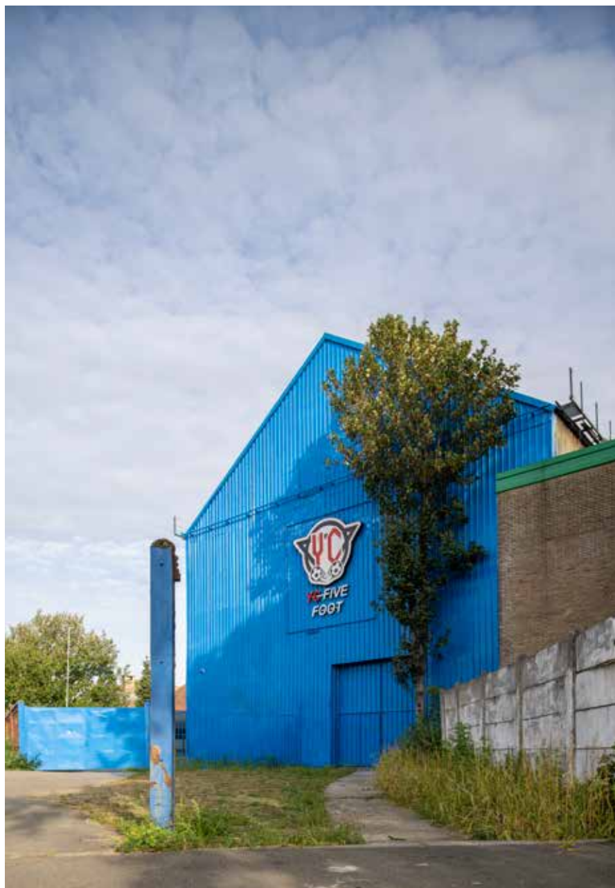
④ De Blauwe Loods of voormalige Focquet-site krijgt een nieuwe bestemming met Vilvoordenaar en voetballer Yannick Carrasco als boegbeeld.

Vorbij dit kruispunt krijgt de N1 Schaarbeeklei als naam. Wat verderop springt aan de linkerkant het Hanssenspark in het oog, het oudste park van Vilvoorde dat in 1898 werd aangelegd en 6,2 ha groot is. Het park legt de link naar de grote stadsvernieuwingsprojecten van Watersite, maar is op een grotere schaal ook deel van de grote blauw-groene dooradering die