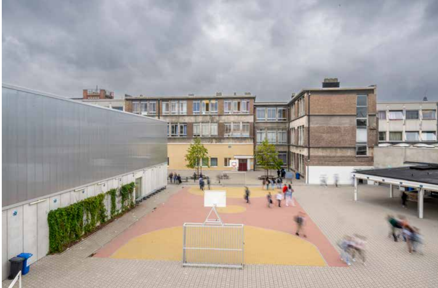
📍 Het Atheneum in Vilvoorde.