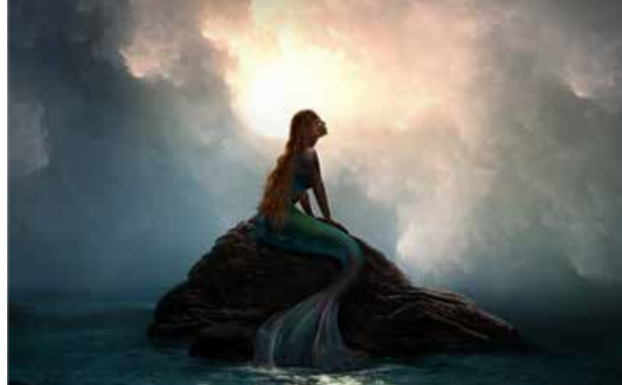
The Little Mermaid (2/11)