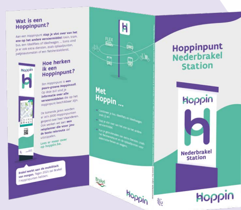
Een folder met alles wat burgers moeten weten over een nieuw Hoppinpunt