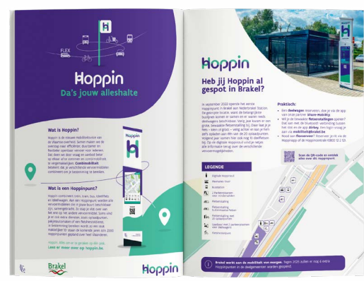
Aanpasbare pagina's voor je gemeentemagazine