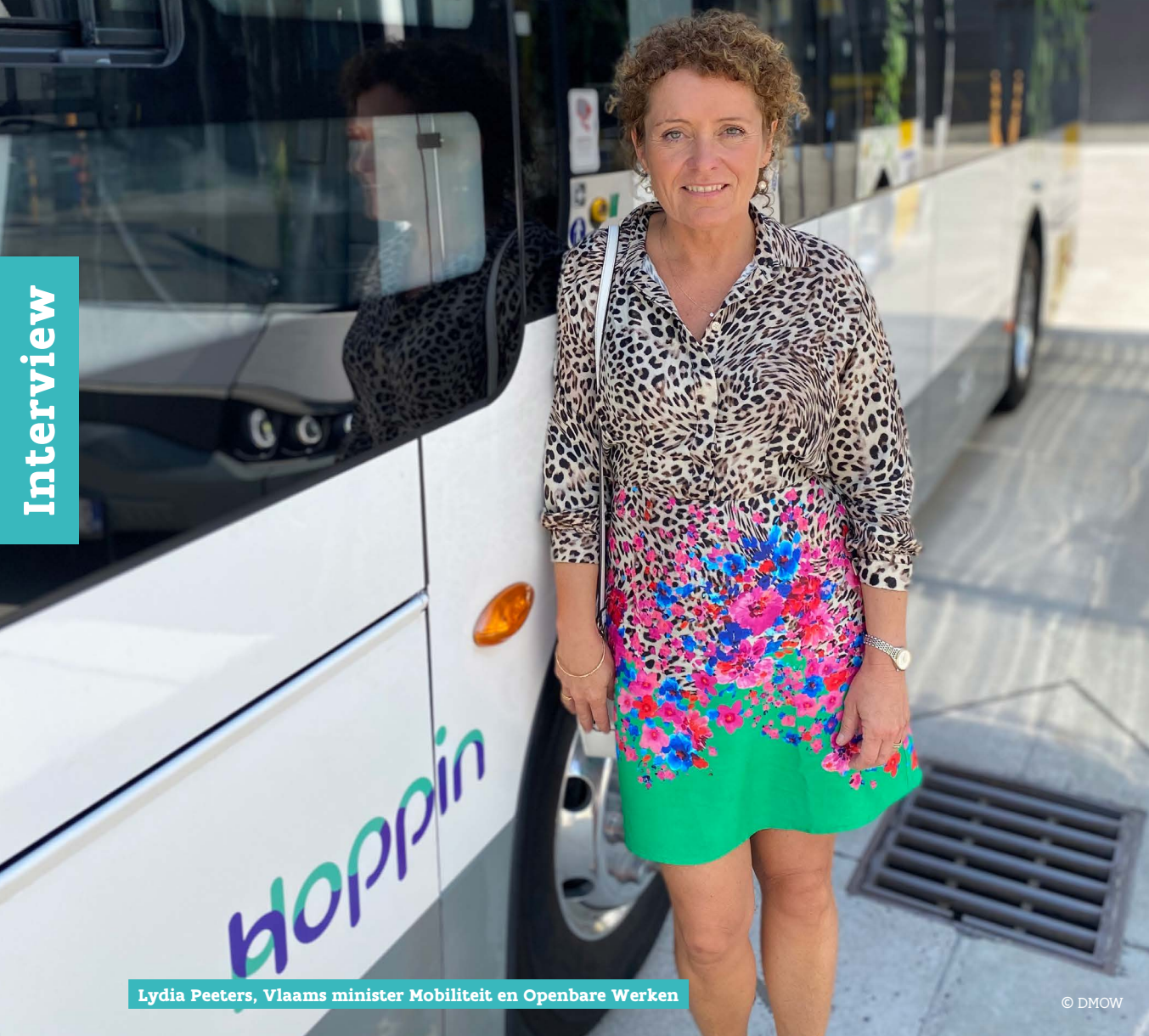
Lydia Peeters, Vlaams minister Mobiliteit en Openbare Werken