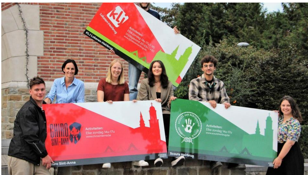
Foto: Uithangborden voor de Lokerse jeugdverenigingen

Ook in Sint-Niklaas bracht men alle jeugdverenigingen in kaart. Groep INTRO en JOS vzw – de ondersteuner van het jeugdwerk in Sint-Niklaas – bundelden hiervoor hun netwerk en expertise. Samen verspreidden ze een helder overzicht van het jeugdaanbod. Groep INTRO waakte er mee over dat de verzamelde informatie bruikbaar was voor gezinnen in een kwetsbare positie en ging het overzicht persoonlijk voorstellen bij heel wat sociale en intermediaire partners. In Lokeren kregen alle jeugdverenigingen een uithangbord om hun werking meer zichtbaar te maken.