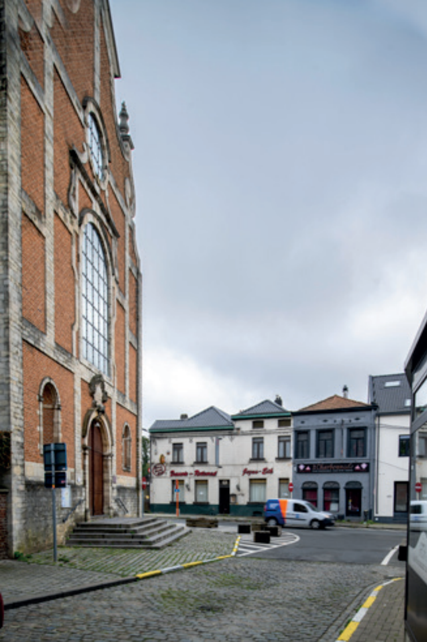
Ⓧ Onze-Lieve-Vrouwerk (Jezus-Eik)

meest opvallende historische panden zijn De Bonte Os en de voormalige markthal. In de Bonte Os vind je sedert 2012 het bezoekerscentrum Druif met een interactieve tentoonstelling over de geschiedenis van de tafeldruif. Ook het toeristische infokantoor van Overijse heeft er zijn stek. Een ander opvallend historisch gebouw is de voormalige markthal uit de 14e eeuw op het hogere deel van het plein. Het was lange tijd het gemeentehuis van Overijse. De voormalige markthal werd grondig gerestaureerd in de jaren 1960 en is nu nog eigendom van de gemeente Overijse die er onder meer vergaderingen in organiseert.