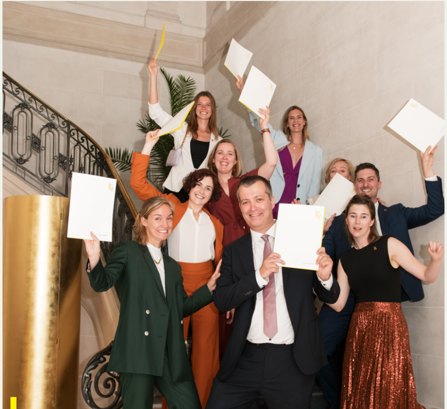
De laureaten van deze lichting ontvingen op 10 juli 2023 in het Errera Huis hun certificaat uit handen van de minister-president van de Vlaamse regering.

In september werden zij uitgestuurd naar de Vlaamse diplomatieke posten bij de EU (Brussel), en in Berlijn, Lilongwe, Maputo, Parijs, en Pretoria.