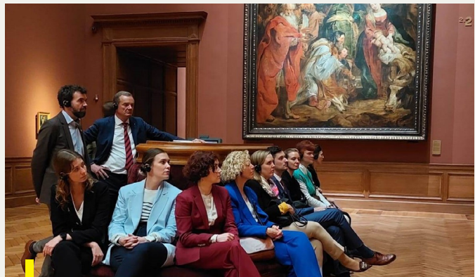
Diplomaten in opleiding bezoeken het Koninklijk Museum voor Schone Kunsten in Antwerpen (15 mei 2023)

De opleidingen vonden doorgaans plaats in Brussel. Het programma investeerde ook zes werkdagen in kennismakings- en terreinbezoeken aan belanghebbende organisaties (stadsbesturen, havens, universiteiten, sectorfederaties, musea, innovatie-clusters, ...) in Antwerpen, Brussel, Gent, Leuven en Oostende.