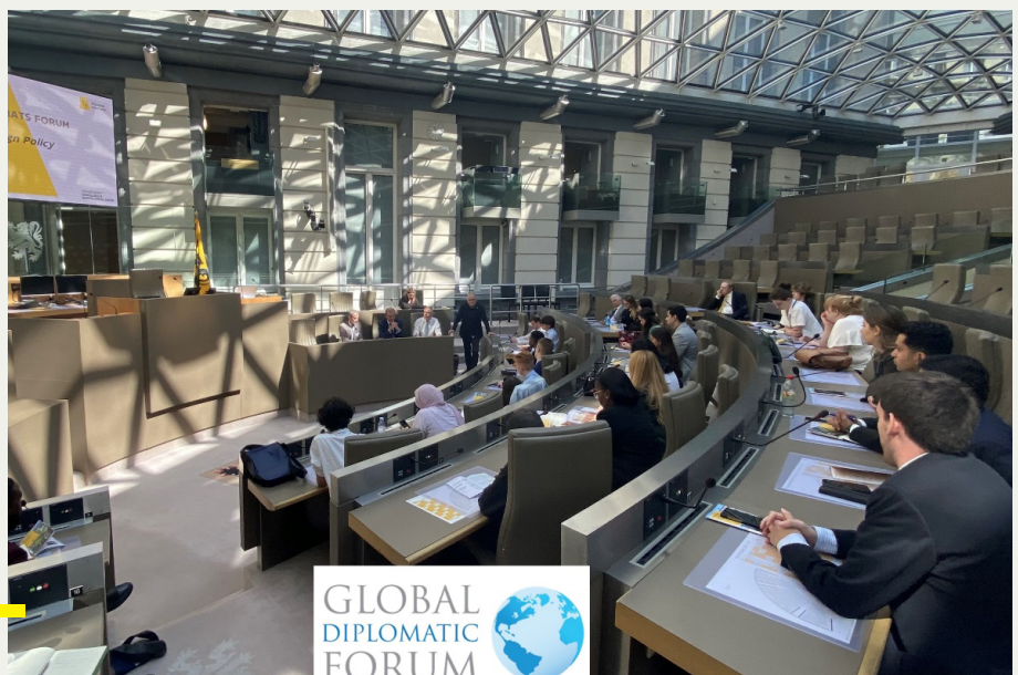
Young Diplomats Forum (Vlaams Parlement, 7 juli 2023)