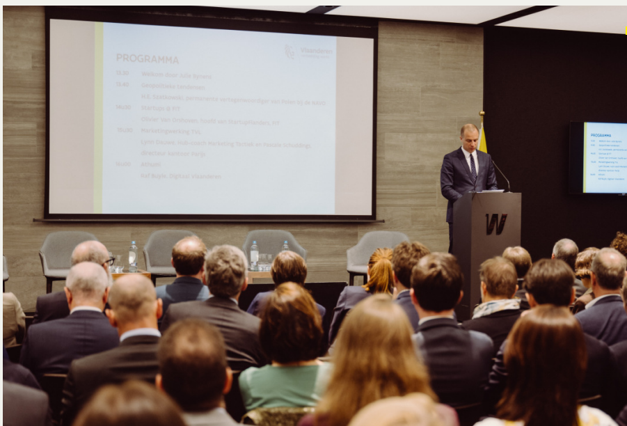
De Permanente Vertegenwoordiger van Polen bij de NAVO spreekt het Vlaams Diplomatiek Korps toe (Vlaamse Diplomatieke Dagen, Brussel, 19 september 2023)

In de zomer van 2023 leverde het departement – samen met het Vlaams Parlement en Flanders Investment & Trade – een bijdrage tot het Young Diplomats Forum in Brussel. Het gaat om een regelmatig hernomen programma van het in London gevestigde Global Diplomatic Forum.