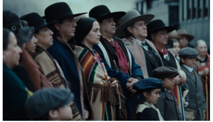
🎬 Killers of the Flower Moon (20/02, 21/02, 25/02)