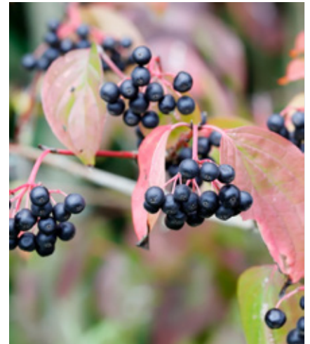
🕒 Rode kornoelje ( Cornus sanguinea )