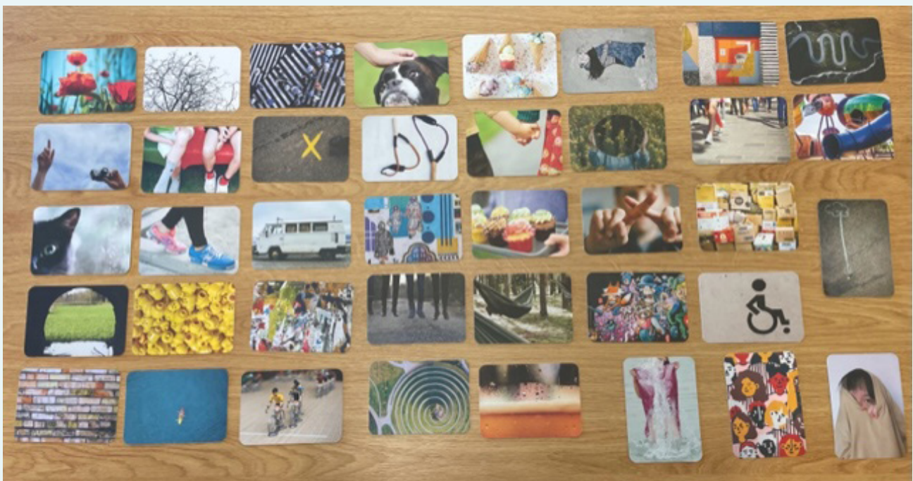
Figuur 2: Babbelbeelden

Bij het beantwoorden van bovenstaande vragen mochten de respondenten hun eigen buurt in gedachte nemen, maar zij moesten zich daar niet toe beperken. Het mocht evengoed gaan over buurten of openbare plaatsen waar zij vaak vertoeven of waarvan ze vaak gebruik maken. De gekozen kaartjes van iedere respondent werden eerst kort in groep besproken en nadien klassikaal teruggekoppeld, waarbij er voor iedere respondent ruimte was om extra toelichting te geven bij de