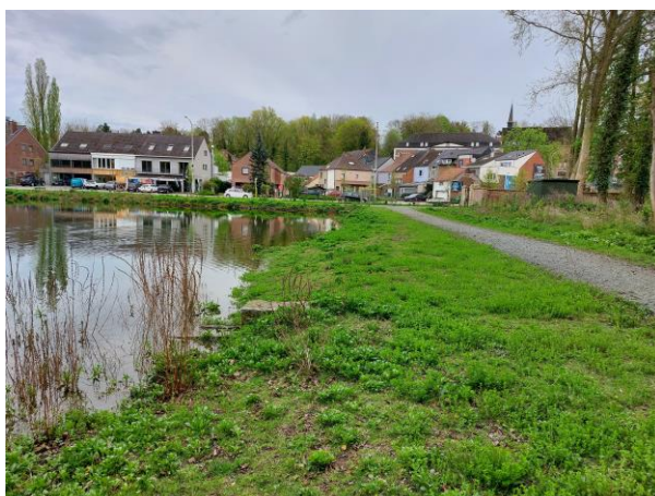
2 - Voorbeeld flauwe oever Kasteelpark Isque