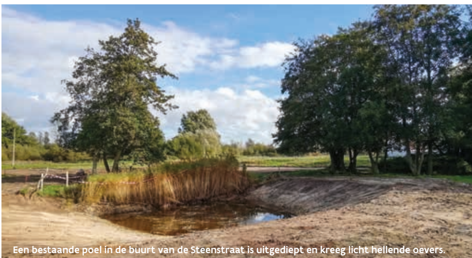
Een bestaande poel in de buurt van de Steenstraat is uitgediept en kreeg licht hellende oevers.

Uiteraard profiteren niet alleen kamsalamanders van deze ingrepen, maar ook een heel pak libellen, vlinders, kevers, ... en andere amfibieën. Zo geven we een boost aan de biodiversiteit van de Schuddebeurze!