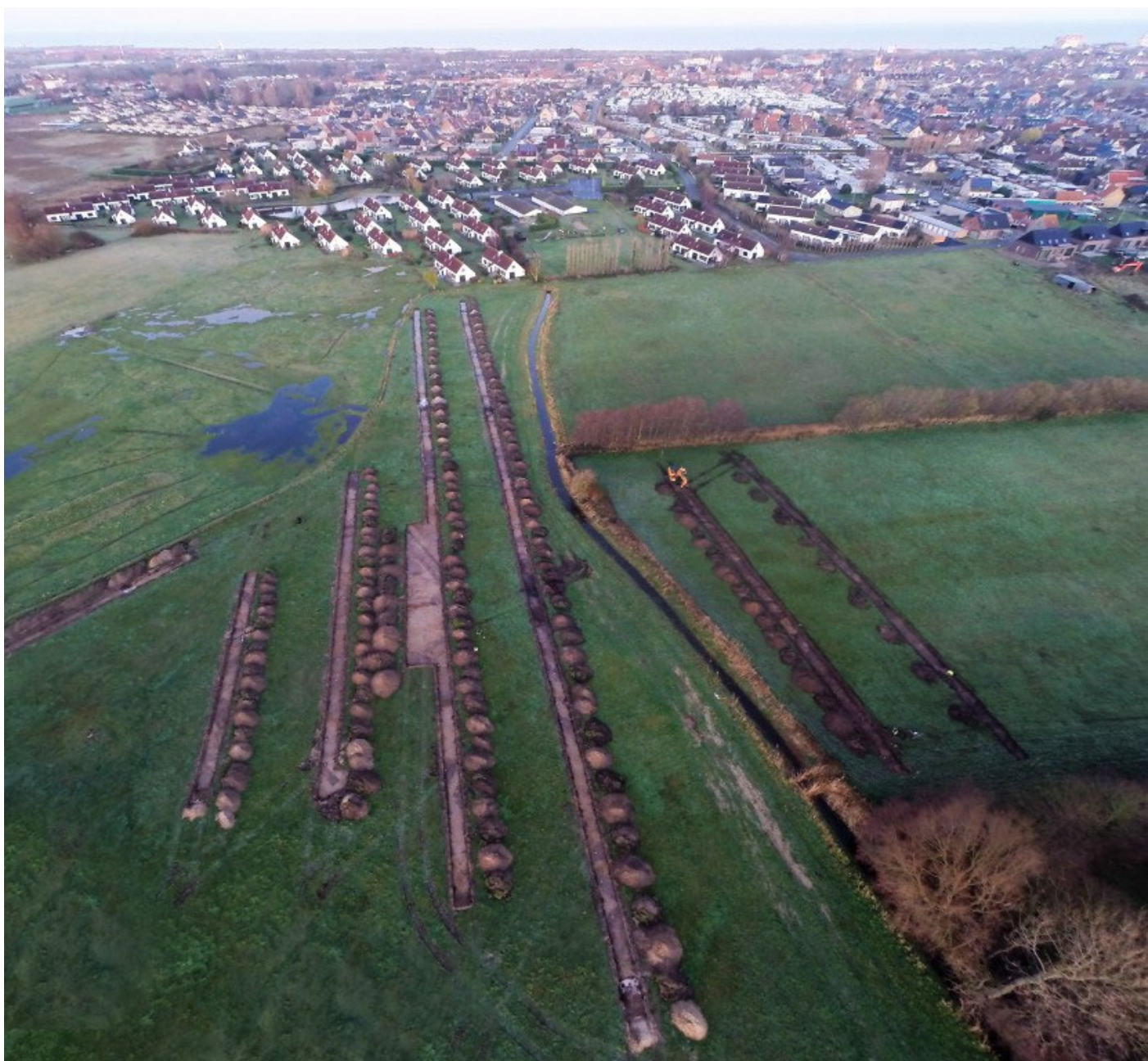
Dronebeeld archeologisch proefonderzoek ten oosten en ten westen van de Schuddebeurzebeek, ©GATE 2019