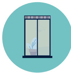
Open je ventilatieroosters