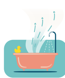
Douchen of baden