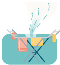
De was drogen in huis