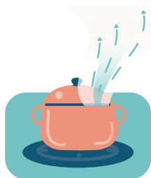
Koken zonder goede dampkap