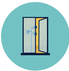
Zet je raam open

Zorg voor een luchtstroom in je huis door verse lucht binnen te laten en vervuilde of vochtige lucht af te voeren.