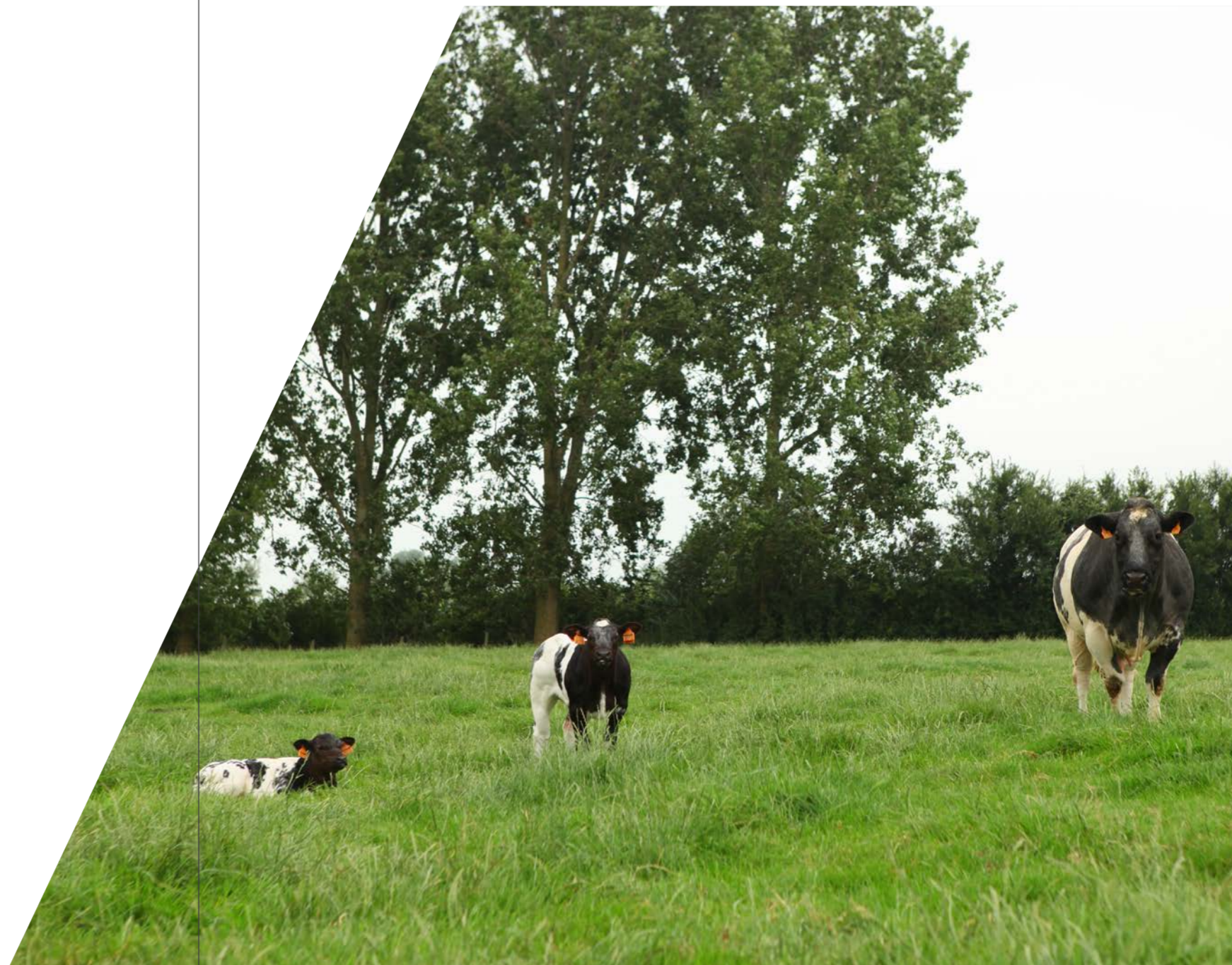
Zoogkoe met kalfjes in de weide.

i Bevoegde administratie en meer info: Agentschap Landbouw en Zeevisserij