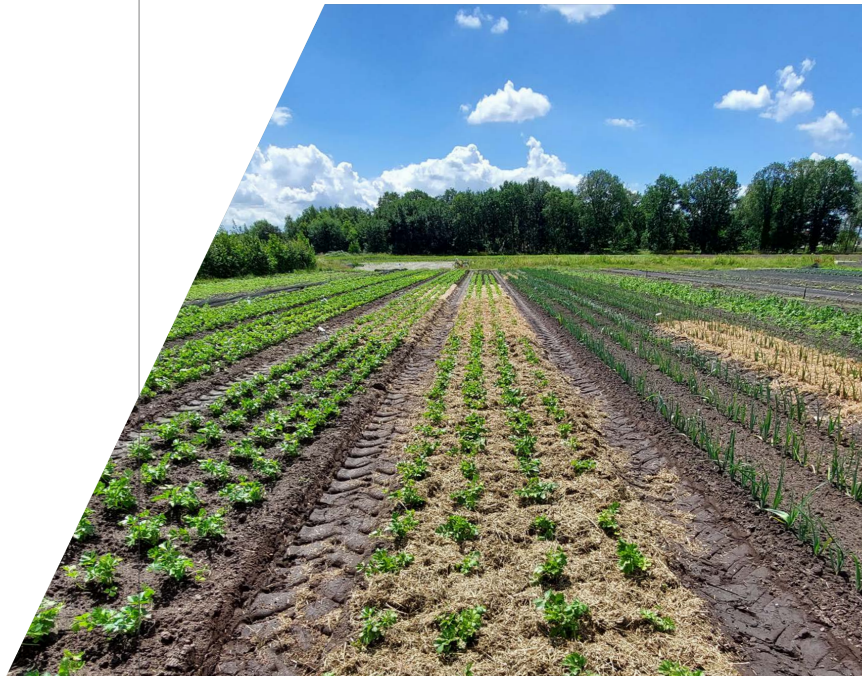
Proefvelden aan het proefstation voor groenteteelt aangelegd voor het demoproject bodemkracht.