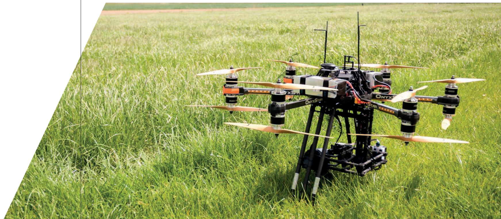
Een drone is klaar om op te stijgen aan de rand van een akker.