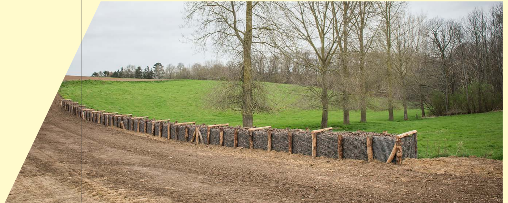
Houthakseldam in Huldenberg, aangelegd met VLIF-NPI en mogelijk gemaakt dankzij het project 'Samen erosie productief indammen'.

Het project 'Samen erosie productief indammen' kwam tot stand door een samenwerking tussen Provincie Oost-Vlaanderen, Vlaams Brabant, provincie Limburg, Inagro, IGO div en Watering van Sint-Truiden.