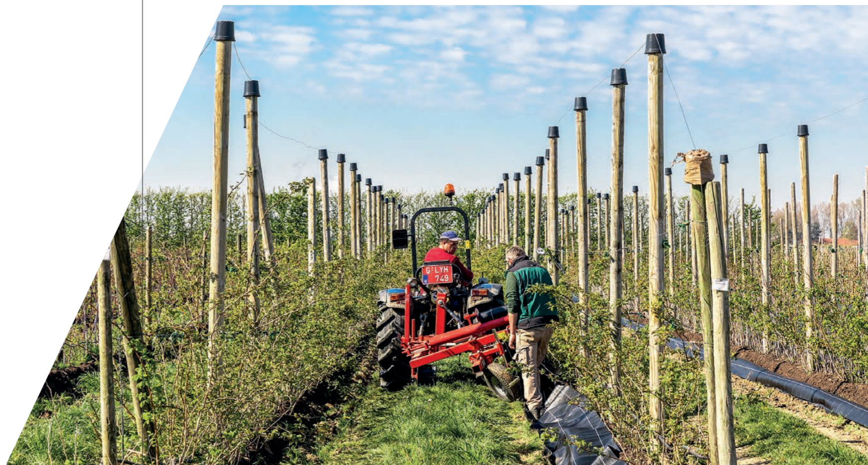
Ontwikkeling prototype machine voor het automatisch plaatsen van gronddoeken in kleinfruitplantages. Bekijk het filmpje op Ontwikkeling prototype machine in kleinfruitsector