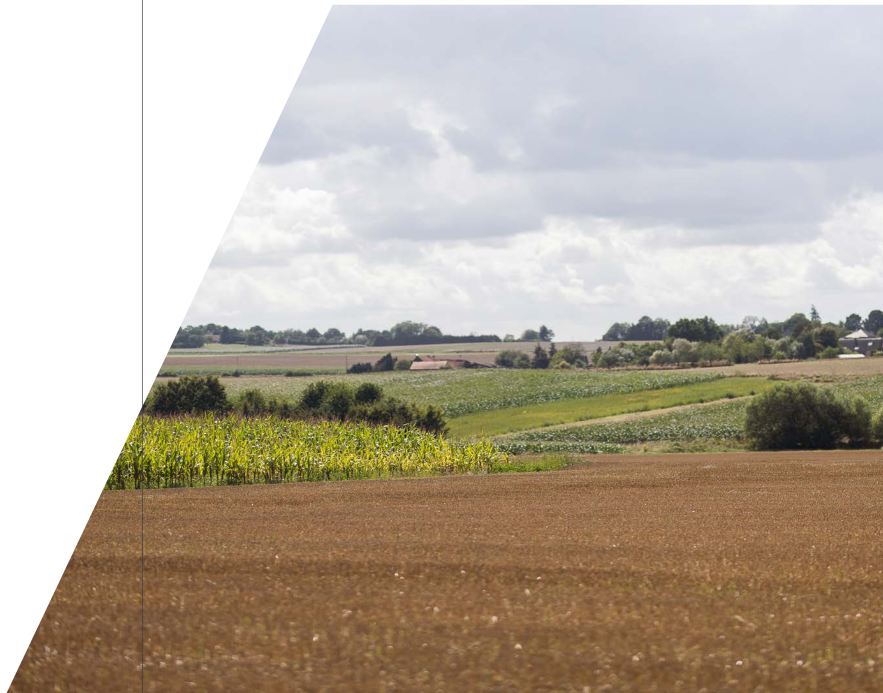
Een versnipperd landbouwlandschap met natuurlijke landschapselementen, woningen en landbouwpercelen.