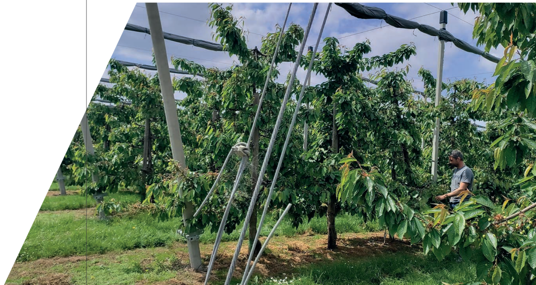
Toon Vanrykel tussen zijn fruitbomen in Zoutleeuw; hij nam in 2018 het ouderlijke bedrijf over.