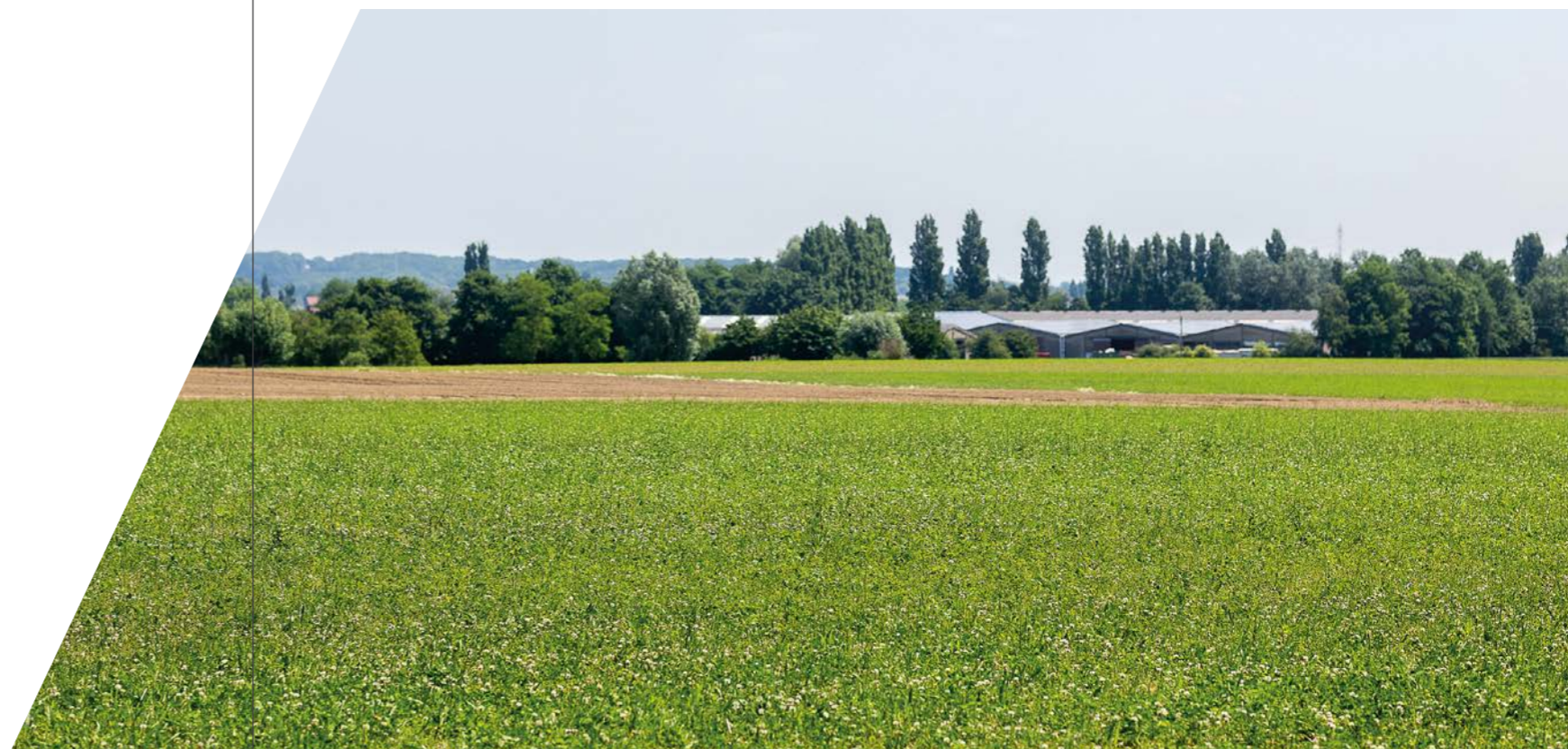
Landschap met op de achtergrond een landbouwbedrijf.