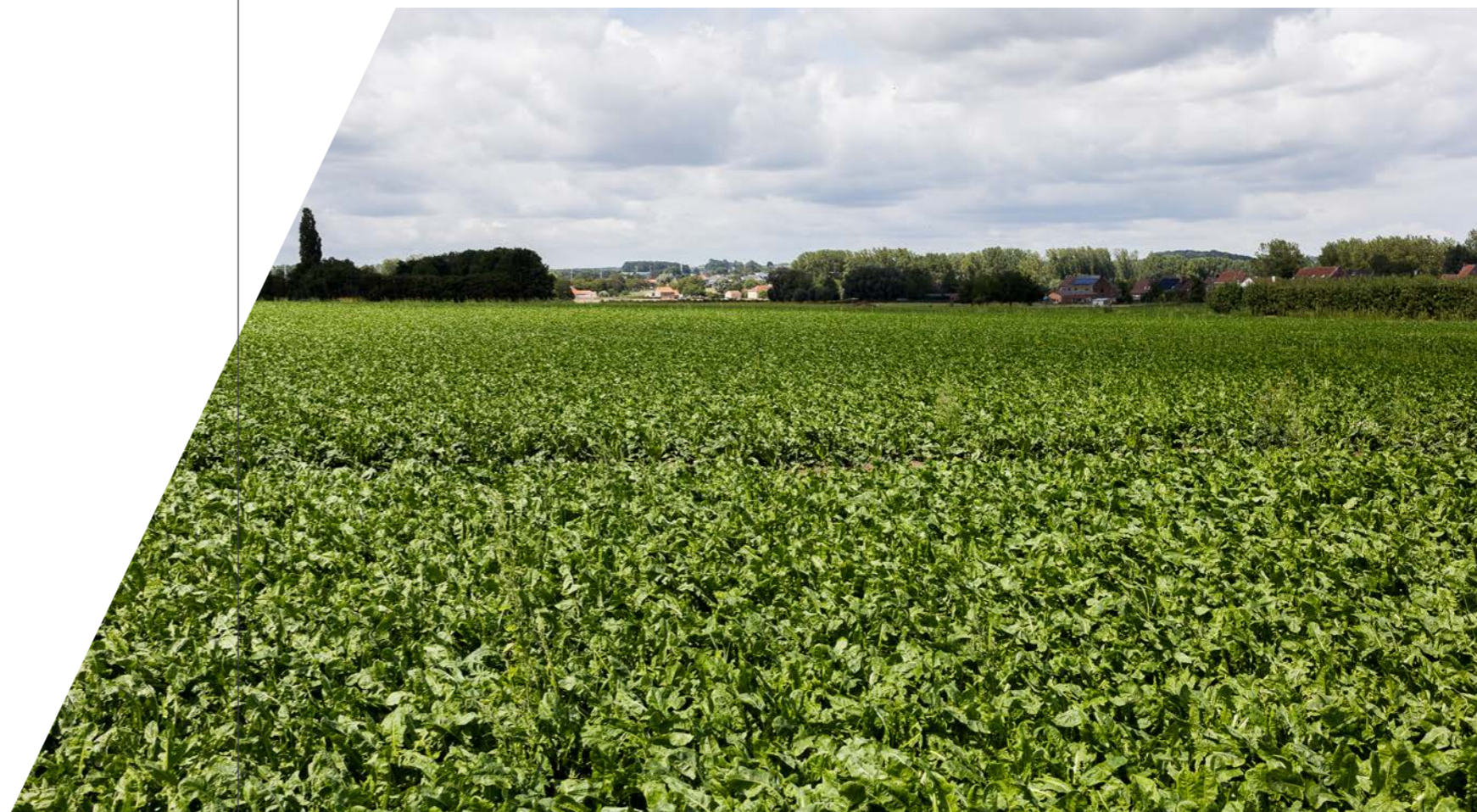
Een landbouwperceel met witloofwortels.

i Bevoegde administratie en meer info: Agentschap Landbouw en Zeevisserij