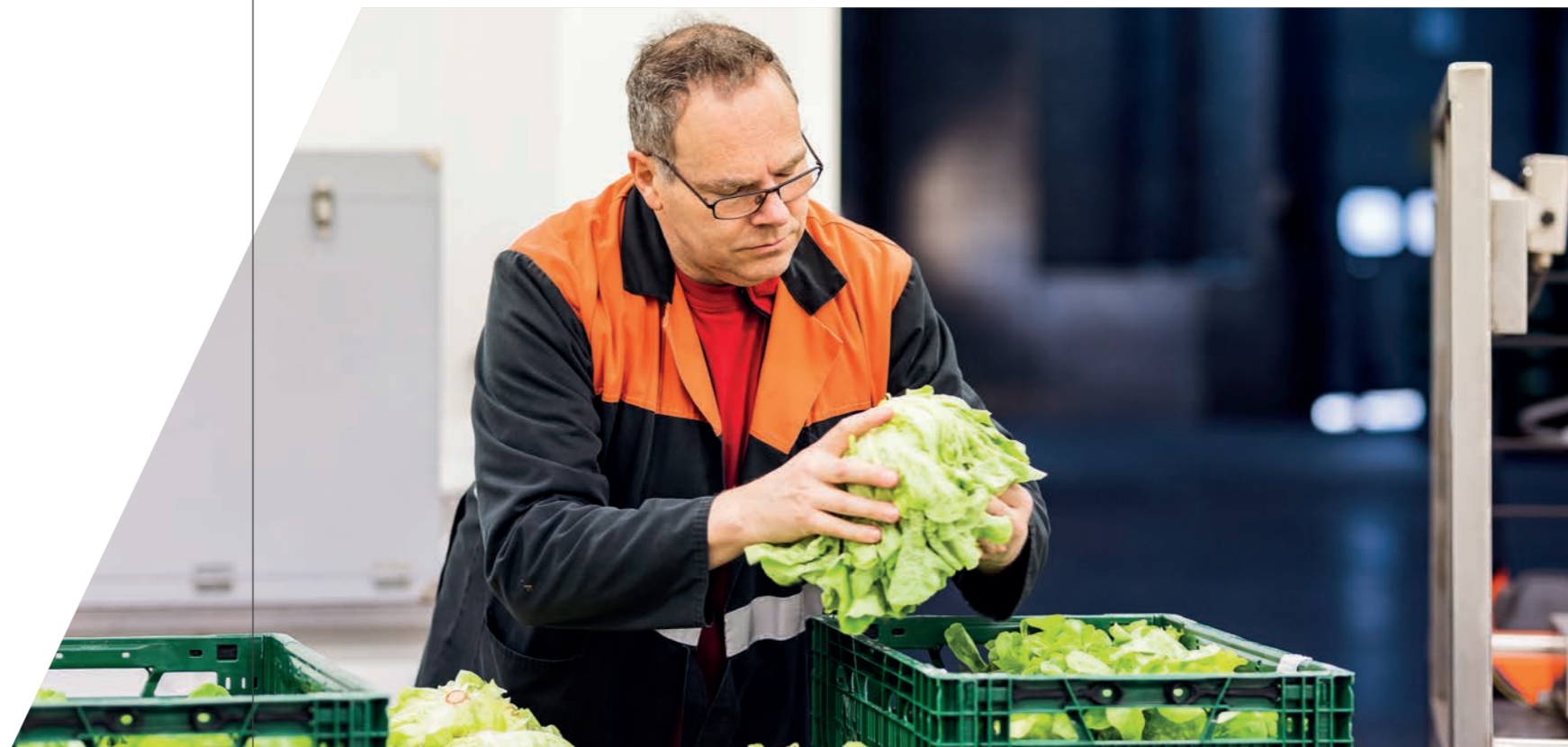
Kroppen sla worden gecontroleerd en in bakken gelegd.

Via de maatregel 'Steun voor de uitvoering van operationele programma's groenten en fruit' kunnen erkende producentenorganisaties (PO) en unies van producentenorganisaties (UPO) een operationeel programma indienen en uitvoeren. In dit programma zitten verschillende acties, zowel op het niveau van de organisatie zelf als op het niveau van de leden-telers. Zo kan er bijvoorbeeld ingezet worden op acties om het aanbod van de verschillende groenten en fruit te concentreren en de afzet ervan te bevorderen. Daarnaast kunnen de acties ook betrekking hebben op o.a. modernisering, productieplanning, afstemmen van aanbod op vraag, onderzoek en ontwikkeling, verbetering van milieu, klimaatadaptatie en mitigatie, kwaliteitsverbetering, promotie, crisispreventie en risicobeheer ... Voor de uitvoering van hun goedgekeurd operationeel programma krijgen PO's en UPO's Europese steun. Via deze steun kan de werking van een PO en UPO dus verder professionaliseren en kunnen land- en tuinbouwers geholpen worden om via hun PO meer marktgericht te werken en betere prijzen te bekomen.