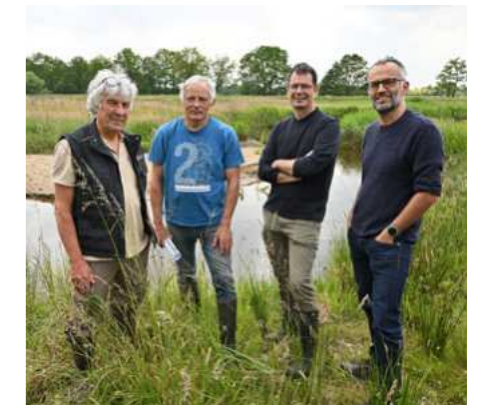
“We hebben 2298 beekprikken overgezet naar de nieuwe loop! Dat is echt wel buitengewoon.”