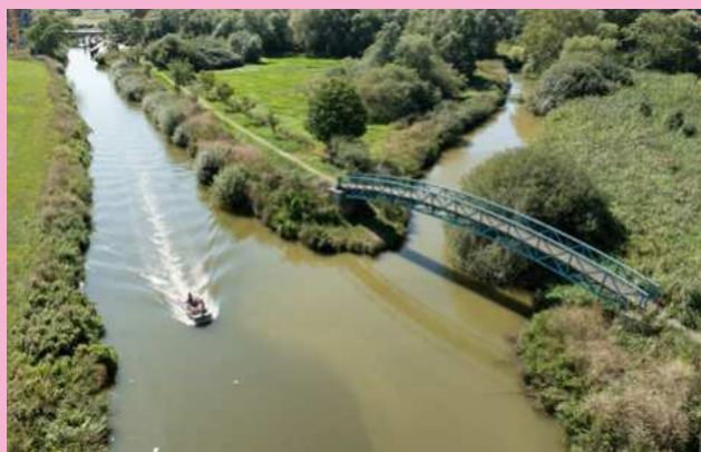
De IJzer bij Roesbrugge: “Er zijn nog vele andere mooie watertjes in de buurt.”