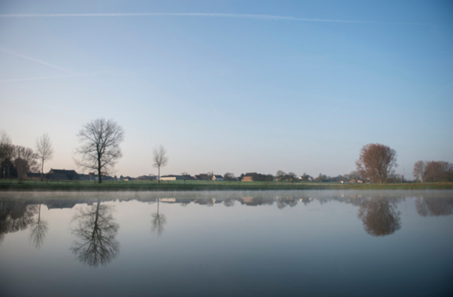
📍 De Zunaanbeek

groter zal worden en de andere kleiner. Voorbij de Camille Leunenstraat komen we alweer bij bufferbekkens uit. Die zijn tegelijk ook uitgerust met hengelpateaus; vissers kunnen er voluit hun hobby beoefenen. Vanaf hier kun je de Zunaanbeek volgen tot in Negenmanneke met aan de ene kant open ruimte en enkele achtertuinen die uitgeven op de Zunaanbeek en aan de andere kant de achterzijde van bedrijventerreinen. Die houden wel niet altijd de vijfmeterzone vrij die moet dienen om de waterloop te kunnen onderhouden. Zo komen we stilaan in Negenmanneke aan. Het gehucht dankt zijn naam aan de tolheffing die er eertijds werd gevraagd aan voorbijgangers die naar Anderlecht en Brussel trokken. Die tol was een achtste van een stuiver en werd één negenmanneke genoemd.