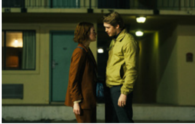
🎧 Kinds of Kindness (5/11)

Sint-Pieters-Leeuw, CC Coloma, 02 371 22 62