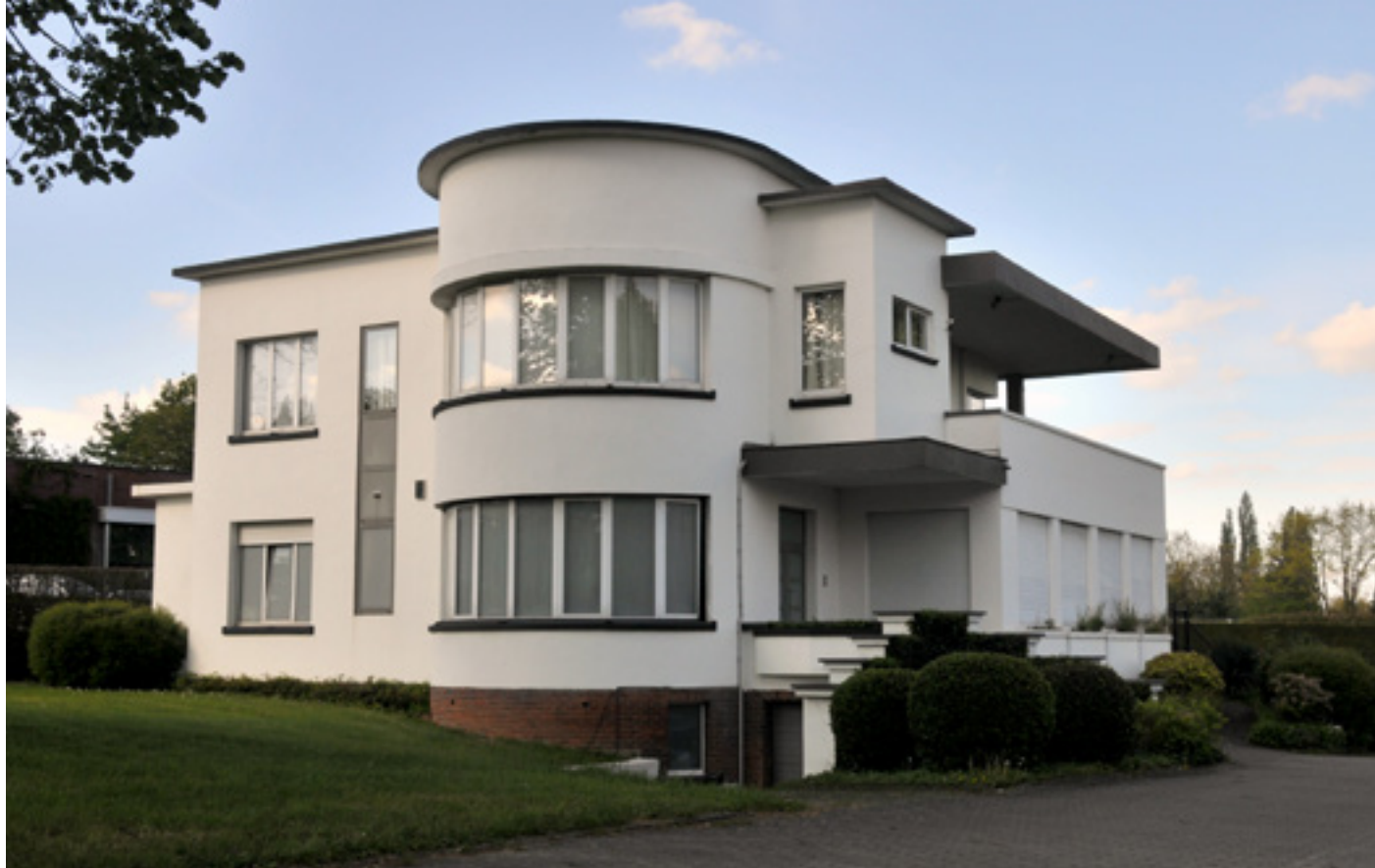
🕒 In 1935 bouwde Arthur Van Lint uit Grimbergen deze villa met een rijk gevulde geschiedenis.