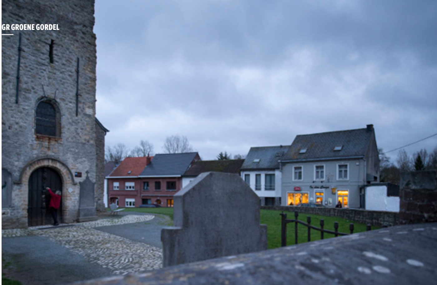
📍 Sint-Pauluskerk (Vossem) met ertegenover het dorpscafé In den Congo.