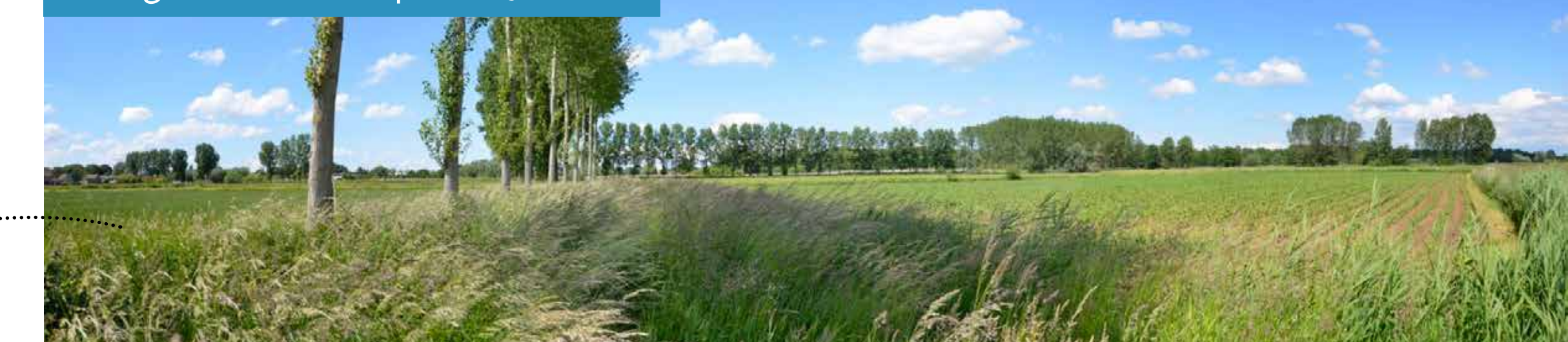
Huidige situatie Reepkens (juni 2022)

De gronden die nodig zijn voor de realisatie van het projectgebied zal de overheid verwerven via het instrument onteigening, met de optie tot zelfrealisatie door private personen.