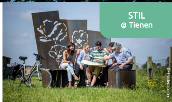
STIL @ Tienen

Este banco, con barandilla de acero corten perforado, proyecta una sombra de amapolas y flores sobre el suelo. Un lugar sereno para detenerse y reflexionar sobre la rica historia del paisaje.