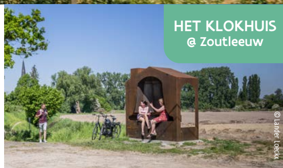
HET KLOKHUIS @ Zoutleeuw

Esta casa en forma de campana hace referencia tanto a la majestuosa capilla e iglesia de San Odulfo como a la palabra «klokhuis» (corazón de manzana/campanario). Una obra de arte lúdica que te arranca una sonrisa.