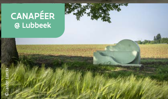
CANAPÉER @ Lubbeek

Siéntate en un divertido banco con forma de pera y disfruta de las preciosas vistas a las flores. Por un momento, esta escultura te permite ser tú mismo la «pepita» de la pera.