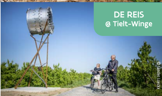
DE REIS @ Tiel-Winge

Esta obra de arte cuenta la historia de los muchos viajes que implica el cultivo de la fruta. Con su aspecto imponente, no atrae a las abejas, sino a los curiosos.