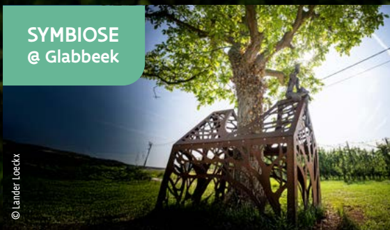
SYMBIOSE @ Glabbeek

Esta obra de arte, una casa abierta alrededor de un árbol, simboliza a los fruticultores fundidos con la naturaleza y la fruticultura. Una oda a la conexión entre el hombre y la naturaleza.