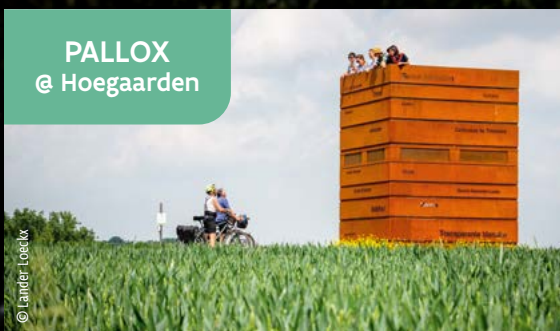
PALLOX @ Hoegaarden

Una torre de cajas de manzanas de acero corten apiladas forma un impresionante mirador. Los nombres de las frutas locales adornan los laterales, mientras que las mirillas ofrecen una espectacular vista panorámica de las flores.