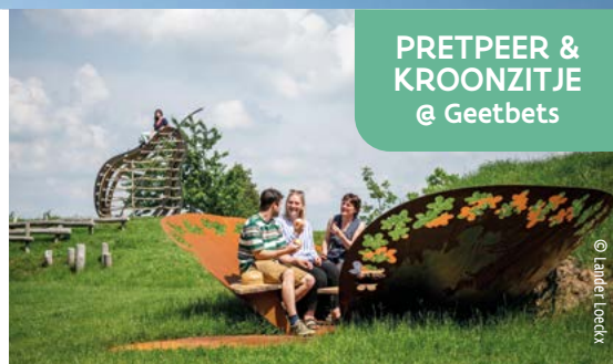
PRETPEER & KROONZITJE @ Geetbets

Un banco de flores accesible, integrado en la pendiente y perfectamente accesible para usuarios de sillas de ruedas. Para el visitante aventurero: escala la pera de enfrente y experimenta la naturaleza de una manera lúdica.