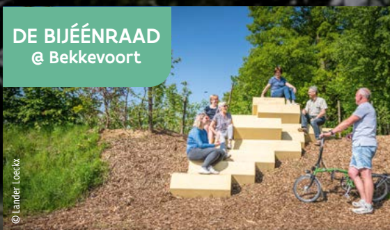
DE BIJÉENRAAD @ Bekkevoort

Estas vigas hexagonales, inspiradas en la estructura de una colmena, crean una acogedora zona de asiento con vistas a las flores. Un lugar perfecto para desconectar y disfrutar de la naturaleza.