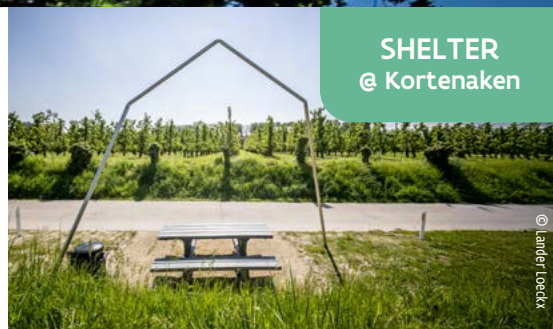
SHELTER @ Kortenaeken

Una casita juguetona que simboliza la sensación de volver a casa. Con su escultura de vistas abiertas, invita a descubrir la región desde una perspectiva dinámica.