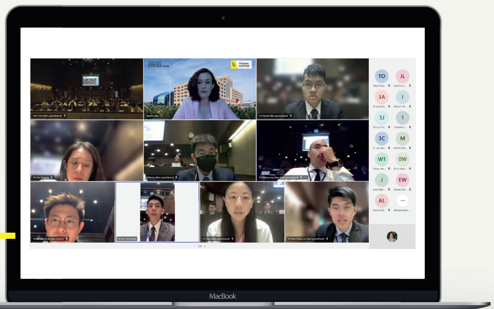
Secretaris-generaal Julie Bynens spreekt de Taiwanese diplomaten-in-opleiding toe, juni 2024.