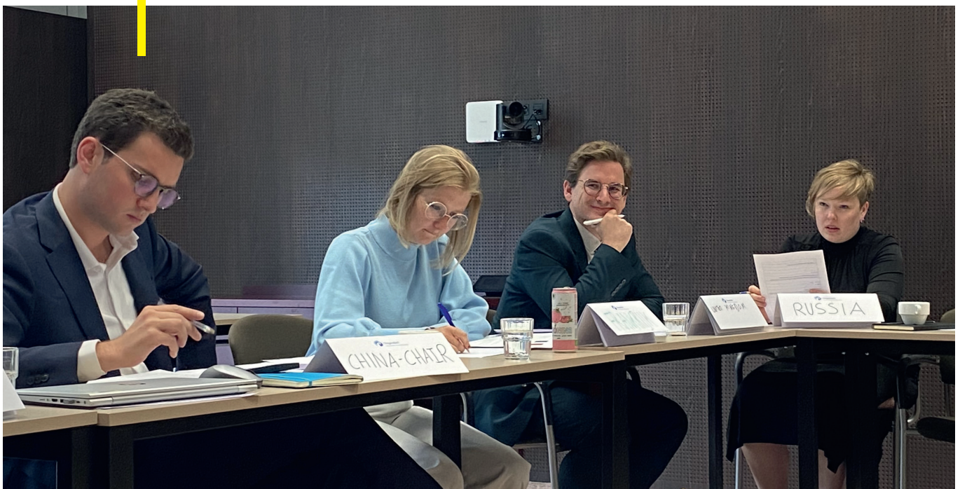
Onderhandelingstraining, Clingendaelinstituut, Brussel, juni 2024

Een derde (15/44) van de externe lesgevers was vrouw. Twee derden (29/44) man.