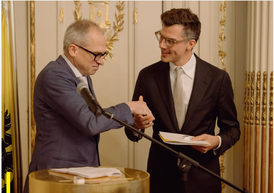
Laureaten van de Diplomatieke Academie ontvangen hun certificaat uit handen van de Minister-President van de Vlaamse Regering, Brussel, 8 november 2024

Een eerste laureaat van de lichting Tijl Uylenspiegel ging per 1 januari 2025 aan de slag als adjunct-Vlaamse Diplomatieke Vertegenwoordiger in London.