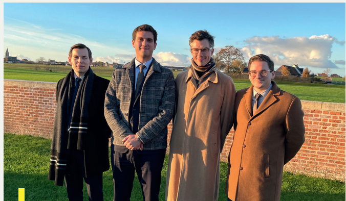
Diplomatieke lichter "Tijl Uylenspiegel". Op werkbezoek in Ieper, 28 november 2024

De opleidingen vonden doorgaans plaats in Brussel. Het programma investeerde ook zes werkdagen in kennismakings- en terreinbezoeken aan belanghebbende organisaties (stadsbesturen, havens, universiteiten, sectorfederaties, musea, innovatie-clusters,...) in Antwerpen, Brussel, Gent, en Ieper.