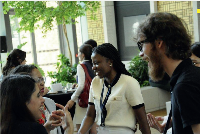
Start van het Young Diplomats Forum in Brussel (HT, 15 juli 2024)