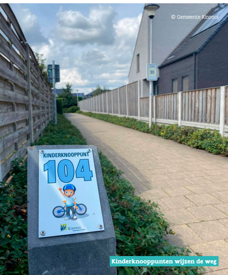
Kinderknooppunten wijzen de weg

'Elke Schakel Telt' is dit jaar het centrale thema op het Vlaams Congres Verkeersveiligheid. Want om Vlaanderen verkeersveiliger te maken, is er nood aan een echte systeembenadering. Niet alleen campagnes en educatie, maar altijd in combinatie met infrastructuur, handhaving en beleid. Wij selecteerden twee straffe voorbeelden.