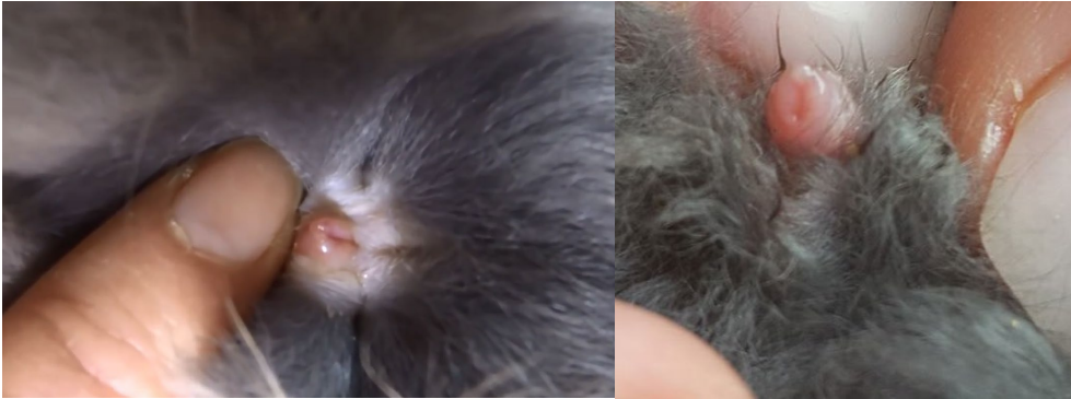
Foto links: Een voedster heeft een U vorming geslacht, een spleetje tot de anus. Foto rechts: Een rammelaar heeft een rondje, soms met opstaande rand, de opening loopt niet door tot de rand.

Konijnen staan bekend om hun snelle voortplanting. Vanaf drie maanden is een konijn al geslachtsrijp. Ze zijn het hele jaar door vruchtbaar en kunnen per jaar wel vier tot zeven keer werpen. Wil je ongewenste nesten vermijden, laat de rammelaar dan castreren. Dat kan vanaf drie maanden. De voedster kan vanaf zes maanden gesteriliseerd worden. Het is aanbevolen om een voedster te laten steriliseren, om baarmoederkanker te voorkomen.