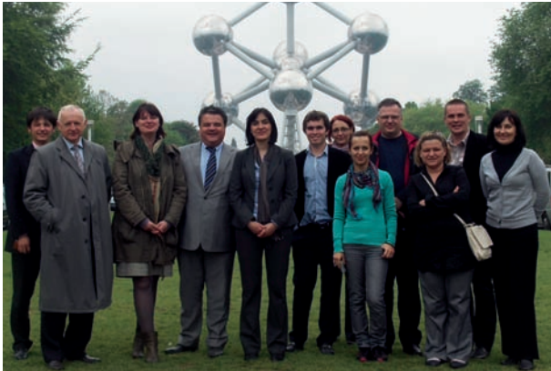
Delegatie uit Bosnië-Herzegovina op studiebezoek in Vlaanderen in kader van Regionaal Competitieve Initiatief.

Naast de opvolging van werkgroepen geeft Vlaanderen ook financiële en inhoudelijke steun aan het South East Europe Investment Compact Program (ICP). Met dit programma wil de OESO sedert 2000 de Zuidoost-Europese landen aantrekkelijker maken voor buitenlandse investeerders, nadat conflicten op het einde van de 20ste eeuw de regio een negatief imago bezorgden. Vlaanderen is van bij de start een betrouwbare partner die geld en expertise levert ter versterking van de KMO-gerichte economieën. Vlaanderen heeft onder andere meegewerkt aan de Investment Reform Index, een instrument om de lokale economieën te vergelijken en hun vooruitgang in kaart te brengen. Op die manier versterken we hun innovatiekracht en menselijk kapitaal binnen het Regionaal Competitieve Initiatief (RCI) en dragen aldus bij aan de stabiliteit van de regio.