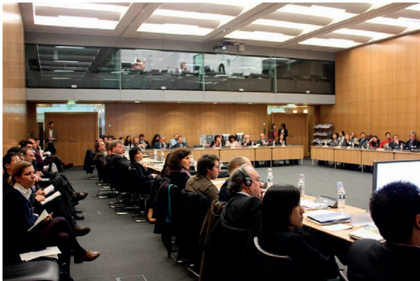
Vlaamse experts ontmoeten internationale collega's binnen OESO werkgroepen.

De OESO is in de eerste plaats een denktank die zich richt op beleidsadvies voor de lidstaten. Hiertoe onderneemt de organisatie doorlichtingen van het beleid van de lidstaten. Het bekendst zijn de Economic Outlook en de Economic Survey, maar dergelijke studies gebeuren ook voor andere thema's. De OESO maakt ook vaak gebruik van peer reviews, waarbij lidstaten vergeleken worden door specialisten van andere lidstaten, al dan niet met best practices als referentie.