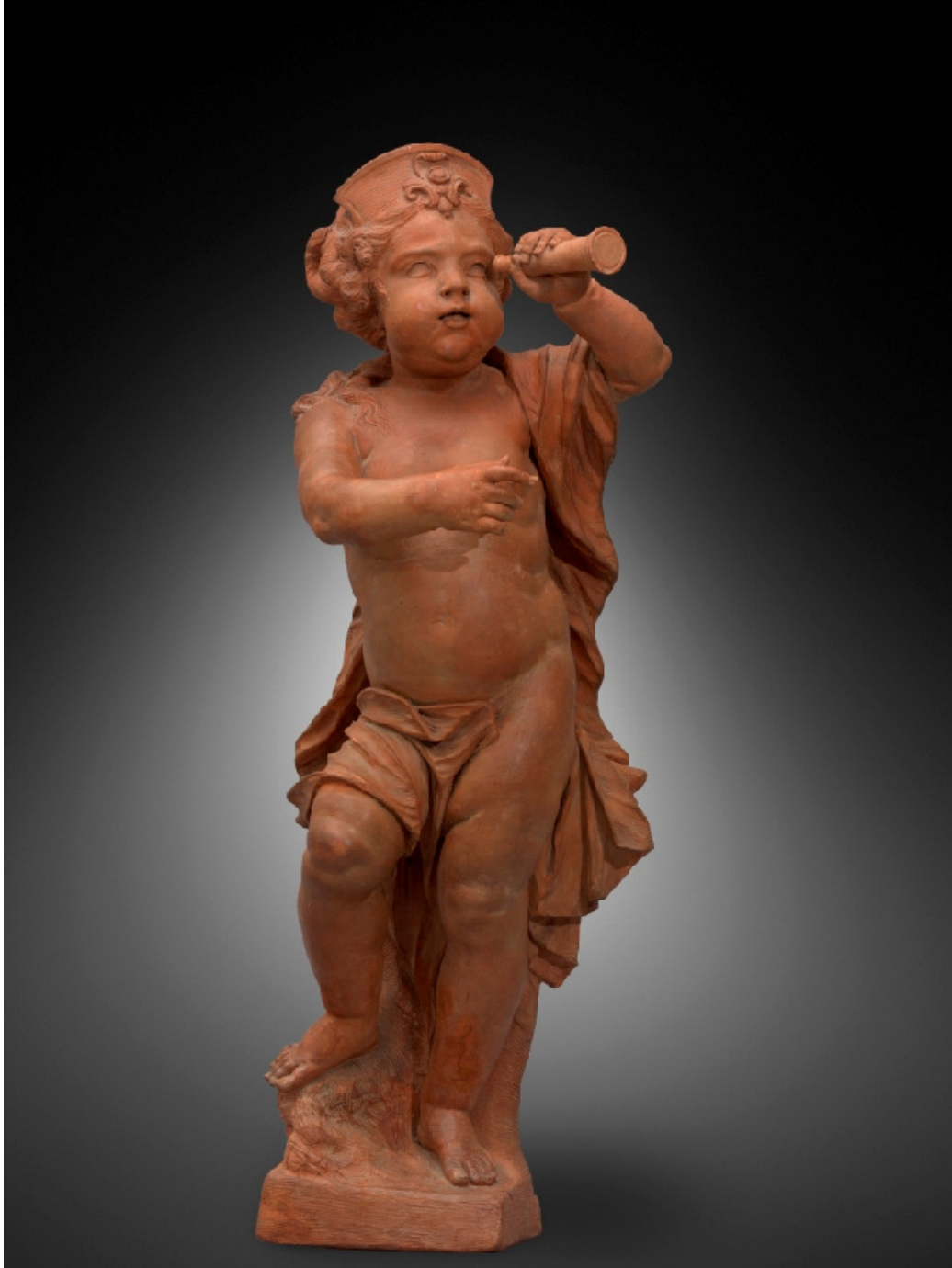
Jan-Pieter van Burscheit de jonge, Het Gezicht