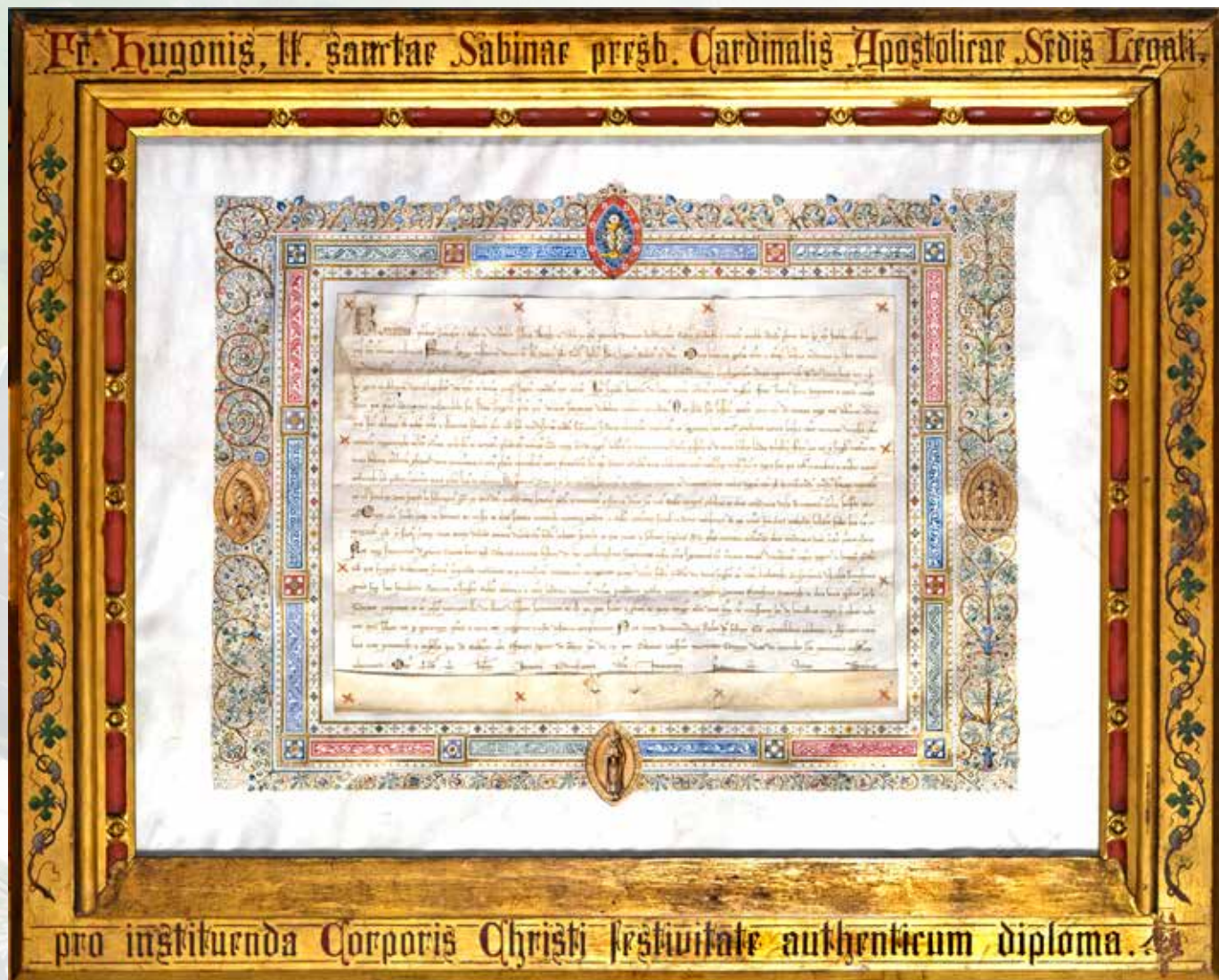
Document du pape Urbain IV concernant La Fête-Dieu

Ondertussen wordt in Alden Biesen met een uitgebreide werkgroep druk verder gesleuteld aan dit prestigieuze project. De enthousiaste medewerkers van het HISAB konden 'Limburg Sterk Merk', Stad Bilzen en de Vlaamse overheid overtuigen om dit unieke initiatief financieel te ondersteunen. Zowel Alden Biesen als KIOSK - een platform voor subsidies in de cultuur- en erfgoedsector - behoren immers tot het Departement Cultuur, Jeugd en Media. Reeds 22 prominenten uit Vlaanderen, Wallonië, Duitsland en Nederland traden toe tot het beschermcomité.