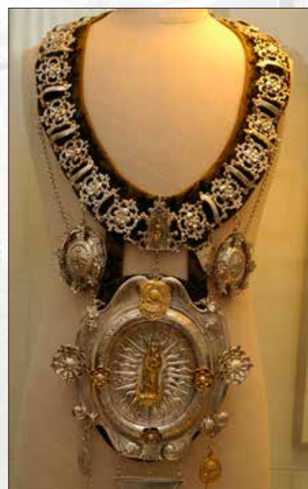
Kraag voor de prins van de Hasseltse rederij- kamer, de Roode Roos