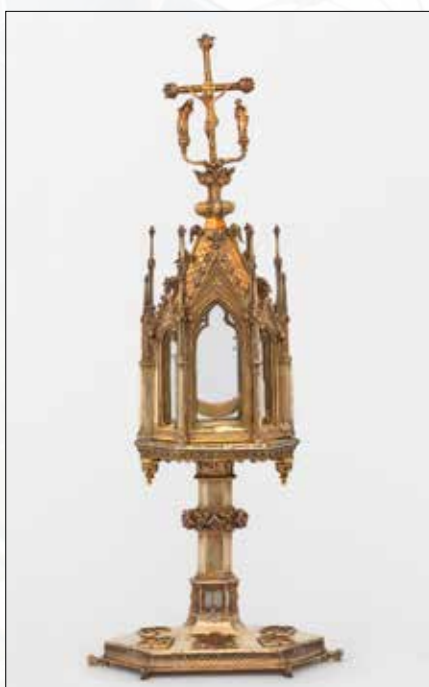
Torenmonstrans van Herkenrode