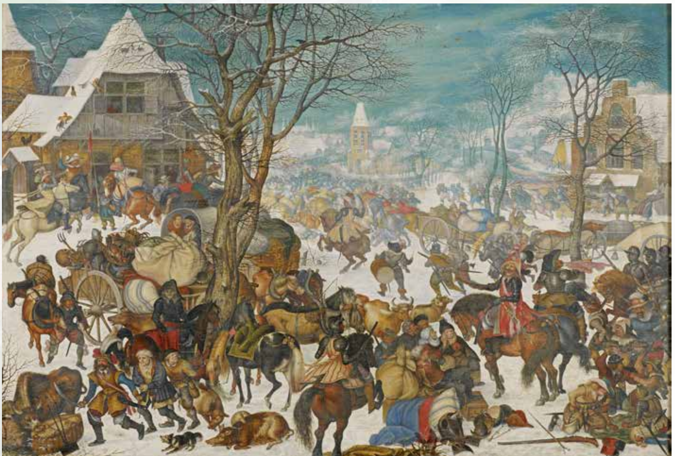
Roland Savery, Plundering van een dorp (S.M.Kortrijk). Uniek doek op de tentoonstelling te bezichtigen!

het prinsbisdom Luik - nooit tot de Nederlanden behoorden. Beide lagen van bij hun ontstaan tot in 1795 ononderbroken in het Heilig Roomse Rijk der Duitse Natie. Door een leenheer-vazalband verbonden met de prinsbisschop van Luik (de staf) en met de Duitse keizer (de troon), speelden de graven van Loon een niet onbelangrijke rol op het Europese toneel. Zo wisten ze door een uitgekende huwelijkspolitiek aanzienlijke graafschappen binnen te rijven, tot zelfs in Beieren (Rieneck) en Noord-Frankrijk (Chiny) toe.