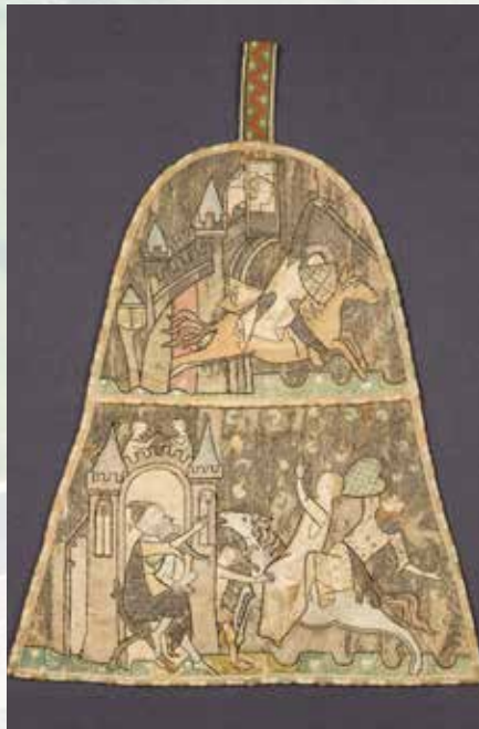
Armenbeurs Teseum Tongeren