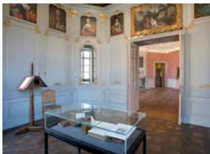
Bibliotheek en appartement van landcommandeur von Sickingen