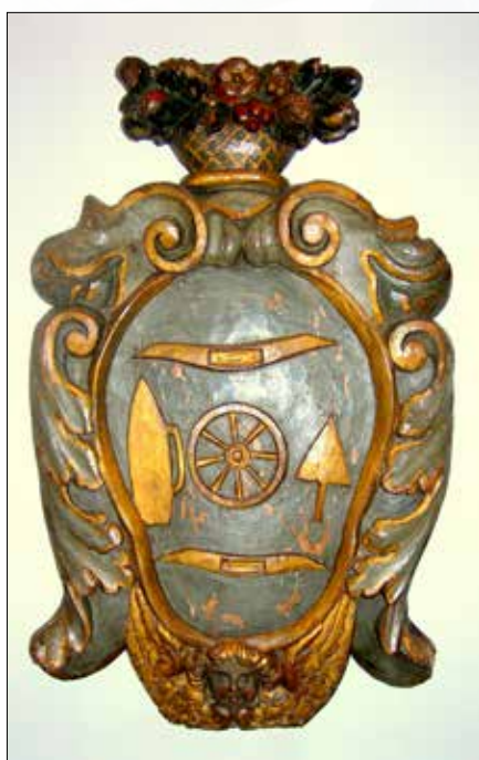
Gepolychromeerd houten schild voor de laken- nijverheid in Hasselt

Op het einde van het bezoek krijgt deze persoon de gelegenheid om het 'geleerde' aan te tonen, de resultaten worden opgeslagen en leiden tot een 'award': een elektronische badge. Deze LOON-badge wordt een voorbeeld voor de culturele & erfgoedsector om zich bewust te maken van zijn potentieel als leerplek.