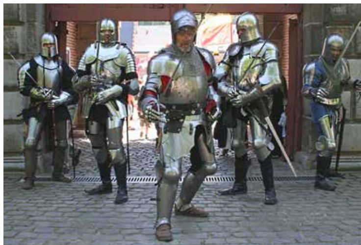
Zwaardridders van Sint-Joris