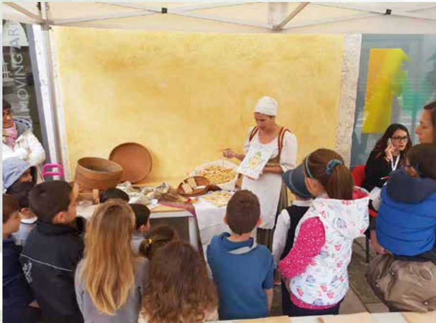
Pasta als culinair erfgoed bij Monumenti Aperti.

Alden Biesen is partner in het Europees erfgoedproject Badges, zoals in het winternummer van dit tijdschrift te lezen viel. Badges is erop gericht kwalitatief leren te ondersteunen in erfgoedsites en dat leren te valideren met een digitale badge in een digitaal portfolio. Iedereen is het erover eens dat je leert wanneer je een erfgoedsite bezoekt, bewust of onbewust. Je vergaart kennis, maar ontwikkelt ook vaardigheden en competenties op sociaal, professioneel of persoonlijk vlak. Maar hoe kan je dat leren zichtbaar maken en waarde geven?