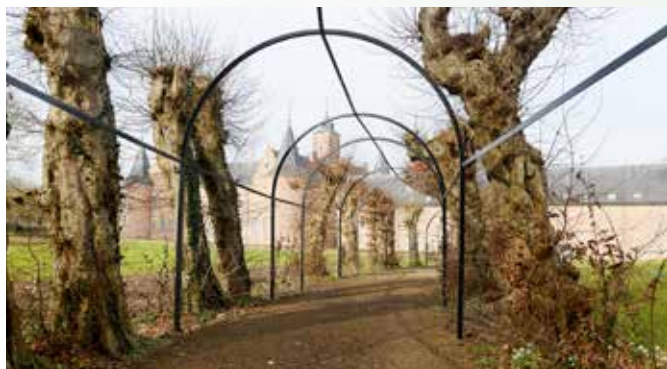
Oude haagbeuken en een nieuwe berceau aangevuld met nieuwe haagplanten.