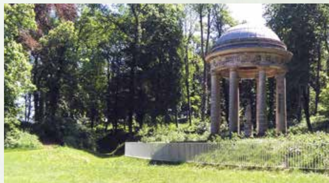
De mergelstenen Minervatempel in een uniek waardevol loof-parkbos.