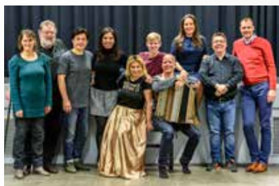
Solisten, dirigent en regisseur van Il Trovatore