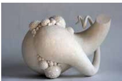
Edith Tergau - Flagella Alba