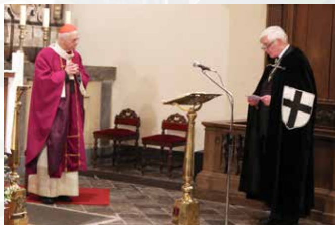
Verwelkoming van kardinaal Jozef De Kesel door de commandeur van de commanderie Alden Biesen van de Duitse Orde tijdens de eucharistieviering in de kerk van Alden Biesen.

Hij werd in zaal "Goer" ontvangen door de commandeur, de erecommandeur en de geestelijke assistent. Daarna werd de pontificale mis gevierd in de kerk van de voormalige landcommanderie. Tijdens zijn homilie beval de Nuntius de heilige Elisabeth aan als voorbeeld voor de Familiares van de Duitse Orde.