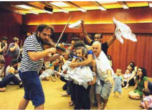
Kunsteducatief labo

Dit labo is de aftrap van de kunsteducatieve activiteiten die Musica de komende jaren op de site van Alden Biesen zal ontwikkelen. Het labo wil kunsteducatoren inspireren, de eigen praktijk kritisch laten bevragen en samen met hen nieuwe perspectieven ontdekken.