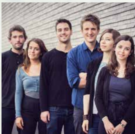
El Gran Teatro del Mundo © E. Rotem