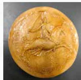
Ruiterzegel van Diederik van Loon en Chiny.