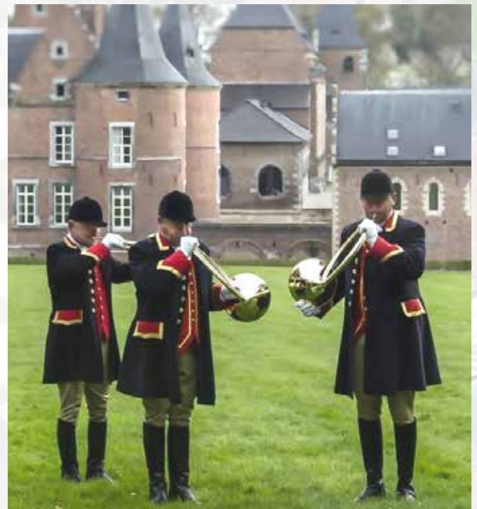
Les Amis, jachthoornblazers