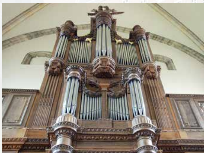
Van Peteghemorgel in Alden Biesen

Het historische Van Peteghemorgel in de kerk van Alden Biesen - een authentiek Vlaams rococo-orgel, het enige orgel in Vlaanderen dat eigendom is van de Vlaamse overheid - wordt regelmatig in de programmatie opgenomen.