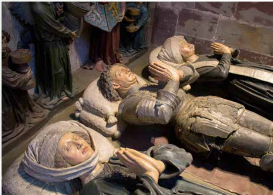
v.l.n.r. Johanna van Loon-Heinsberg, haar gemaal graaf Johann II van Nassau-Saarbrücken en diens 2de echtgenote Elisabeth von Württemberg - Urach.