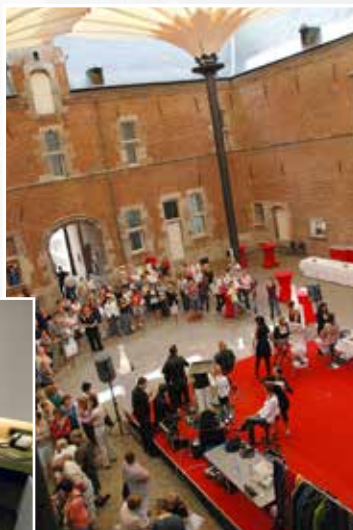
Workshop op Erekoer