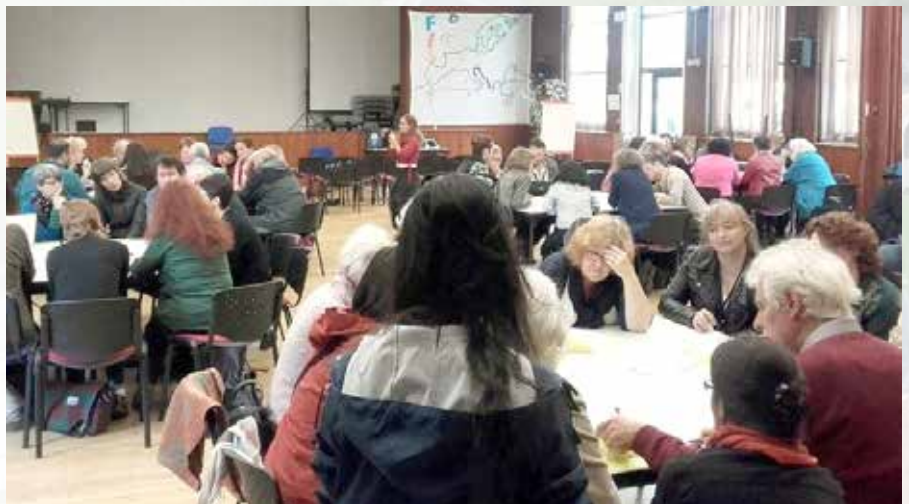
FEST-conferentie in Parijs