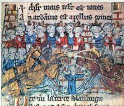
Het tornooi van Chauvency (1285) georganiseerd door Gerard van Loon-Chauvency en Lodewijk V van Chiny.