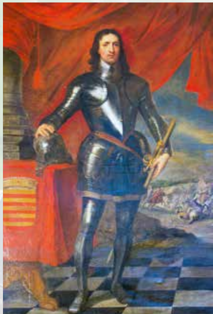
Arnold II, graaf van Loon, stichter van de abdij van Averbode.