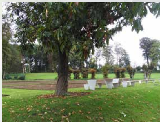
Picknickzone bij de prairietuin