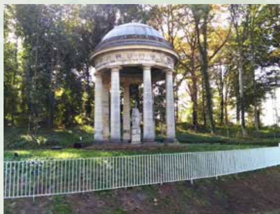
Omheining rond de Minervatempel

Lees de uitvoerige reportage in een volgend nummer!