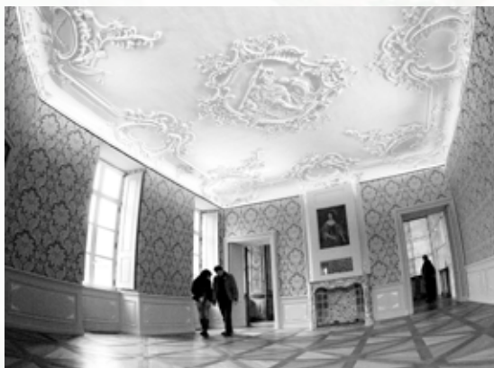
Appartement van de Landcommandeur