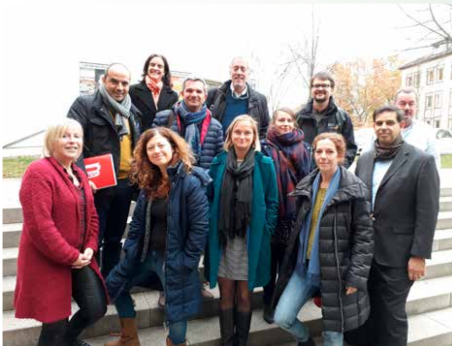
Kick Off in Kassel