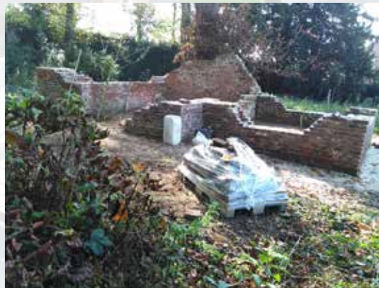
Restanten van de hermitage