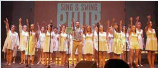
Sing en Swing