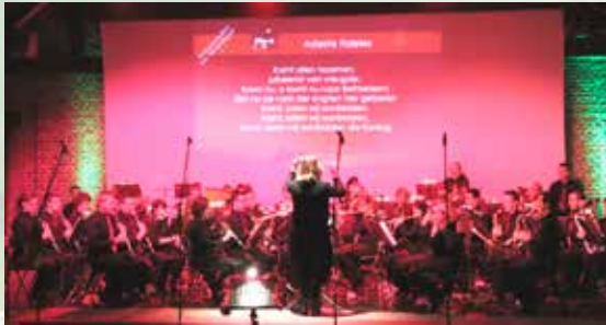
K.H. De Eendracht