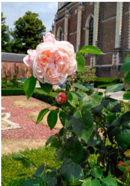
Mayor of Casterbridge

De Engelse rozen zijn wellicht het jongste stadium in de ontwikkeling van de rozen-wereld (vanaf 1870 worden nieuw ontwik-kelde rozen als 'modern' gecatalogeerd). De bekende Engelse rozenkweker David Austen ontwikkelde omstreeks 1960 de eerste 'Mayor of Casterbridge'. Zij werd genoemd naar de titel van een roman van