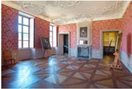
Appartement van de Landcommandeur

17 september, 15 oktober, 19 november en 17 december