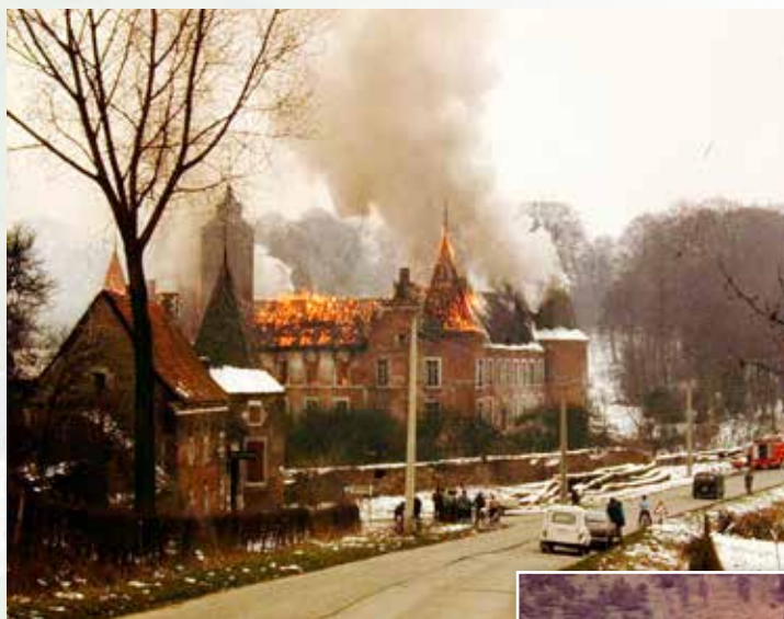
Alden Biesen brandt (1971)