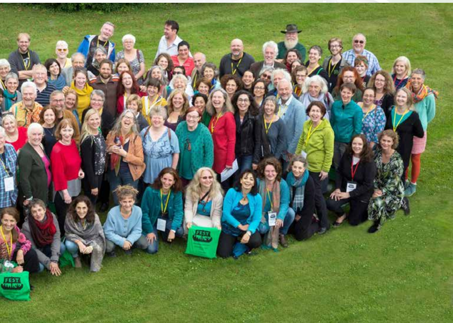
FESTconferentie 2017 Termonfeckin (IRL)