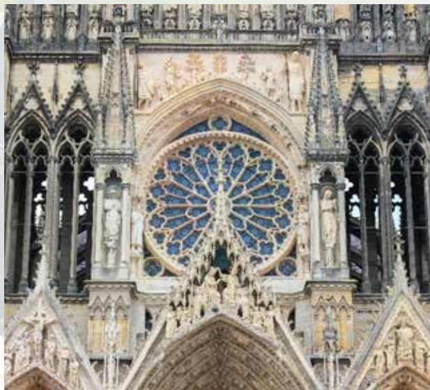
Kathedraal Notre - Dame, Reims (FR)

De vroege renaissance in Italië en het hoogtepunt van de gotiek vallen chronologisch samen. Terwijl de internationale gotiek vanuit Parijs en de Bourgondische gewesten grote delen van Europa bekoort, beconcurrereert de Florentijnse vroeg-renaissance de kunst van de Vlaamse Primitieven. Geleidelijk vinden noord en zuid elkaar: de renaissance wordt een Europees verschijnsel met regionale accenten.