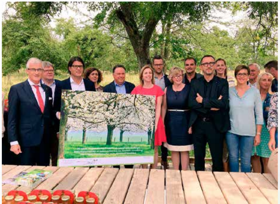
Vlaams minister-president Geert Bourgeois met de vertegenwoordigers van de betrokken Haspengouwse gemeenten bij de ondertekening van de intentieverklaring.

De grootste concentratie hoogstamboomgaarden is gelegen in Haspengouw en Voeren. De grootste aaneengesloten hoogstamboomgaard ligt zelfs in Alden Biesen. De boomgaarden worden vandaag opnieuw gewaardeerd omwille van hun erfgoedwaarde, als genendatabank van oude fruitrassen, omwille van hun ecologische (een heel eigen ecotoop) en esthetische (én toeristische) waarde. Verschillende boomgaarden zijn beschermd en vanuit allerlei hoeken worden acties opgezet om hen te behouden en te herstellen. Toch blijven ze onder druk staan en kampen ze met beheerproblemen zoals