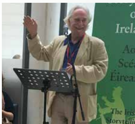
Jack Lynch gastheer in Ierland

op in vele sectoren. Alle media hebben een 'verhaal te vertellen'. In dit verband heeft de vertelkunst als 'meester van het narratieve' veel te bieden aan de nieuwe media en deze, op hun beurt, bieden nieuwe mogelijkheden en 'interfaces' voor verhalen. Daarom wil FEST de synergie tussen het mondeling vertellen en nieuwe-media-kunstenaren versterken via cocreatieve producties.