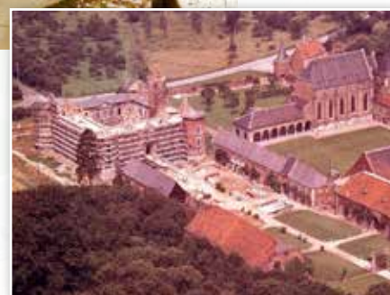
Alden Biesen in restauratie

De mobilisatie in WO II en de opeenvolgende bezetting door Belgische, Duitse en Amerikaanse troepen hebben het kasteel geen goed gedaan. Duitse fotografen leggen nu ook het interieur gedetailleerd vast, beeldmateriaal dat later bijzonder nuttig blijkt bij de heropbouw. Zij 'klasseren' het gebouw zelfs en koesteren plannen voor