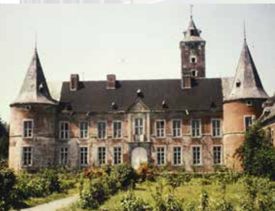
Alden Biesen vóór 1971

De imponerende architectuur van Alden Biesen kan je alleen maar begrijpen vanuit zijn verleden als landcommanderij van de Duitse Orde. Het 16de-eeuws complex is niet ontworpen als residentie voor een adellijke familie zoals de meeste Haspengouwse kastelen, maar als bestuurscentrum mét standing voor een enorm patrimonium aan bezittingen. Een belangrijke schakel in de gigantische organisatie die de Duitse Orde in het Heilig Roomse Rijk en daarbuiten was. Vandaar de omvang, de imposante opbouw, de schitterende afwerking, buiten categorie in de regio.