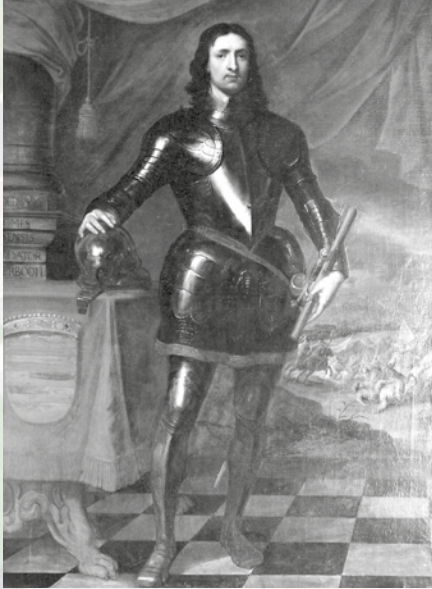
Graaf Arnold II van Loon (112535 - 113839), stichter van de abdij van Averbode.

Met de viering van 1000 jaar graafschap Loon in het achterhoofd kan je je afvragen of de Loonse graven iets te maken hebben gehad met de oudste stichting van het eerste Duitse Ordehuis in Biesen. Natuurlijk wel, de graven zaten al achter haast elke abdijsstichting op hun grondgebied. En dat was hier niet anders, zelfs al voor de site bezit werd van de Duitse Orde in 1220. In 1216 wijdde bisschop Dietrich von Treiden er immers een eerste kleine kapel. Die Dietrich was niet van de minste: stichter van de Orde van het Zwaard (die later in de Duitse Orde zou opgaan), cisterciënzer abt van Düramünde en bisschop van het missiegebied Estland, waar hij in 1219 ook zou sneuvelen. Bisschoppen droegen indertijd niet alleen hun staf en mijter maar hanteerden ook het zwaard tegen de heidenen...