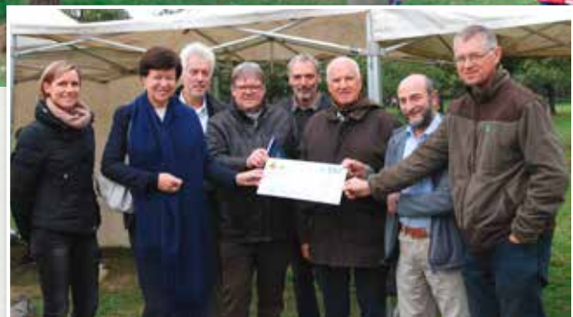
Persconferentie 'Bilzen, de boom in' op 14 oktober.