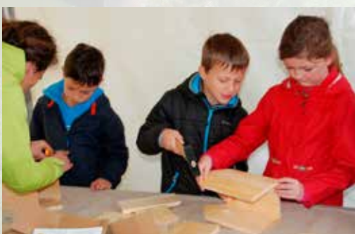
Kinderen timmeren nestkastjes.