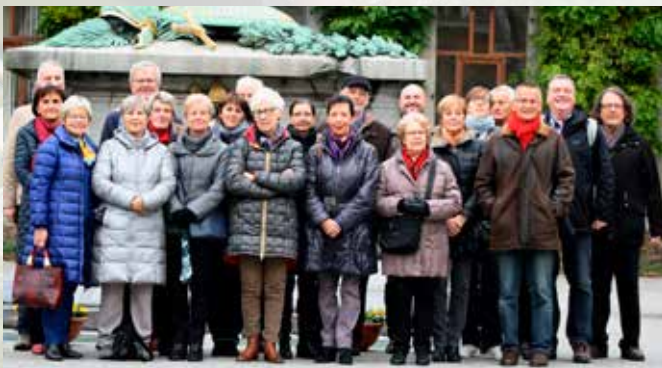
De gidsen voor het Malmundarium en het monument voor de gesneuvelden in Malmedy.

Als uitsmijter werd ook Stavelot aangedaan, dat zijn 18de eeuwse gelaat nog goed bewaard heeft. De stadswandeling omvatte de opgegraven funderingen van de abdijkerk, de oude straatjes en steegjes met de verschillende 'fontein' en de parochiekerk met het unieke schrijn van St-Remacle.