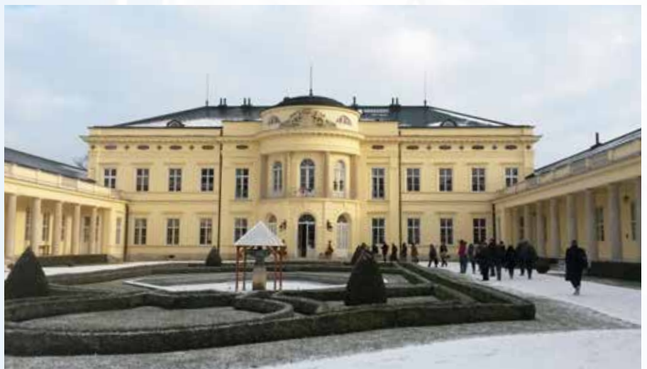
Károlyi Kastély (HU)