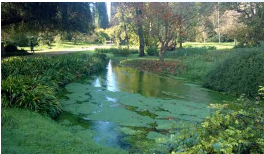
Ninfa tuinen (IT)

InHerit is een Grundtvig Multilateraal project, gecoördineerd door Alden Biesen, en wil de (leer)ervaringen van bezoekers aan erfgoed-sites en musea verbeteren door de interpretatiecompetenties van het betrokken personeel te ontwikkelen. InHerit richt zich tot managers, gidsen, curatoren in erfgoed-sites die hun banden met hun publiek willen versterken.