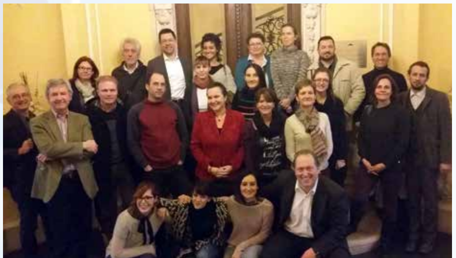
Het Modify-team in Boedapest (HU)