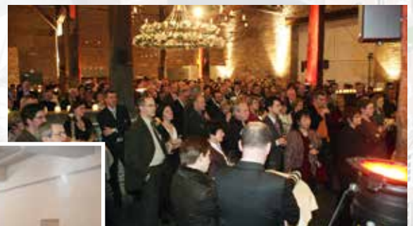
Receptie in de Tiendschuur