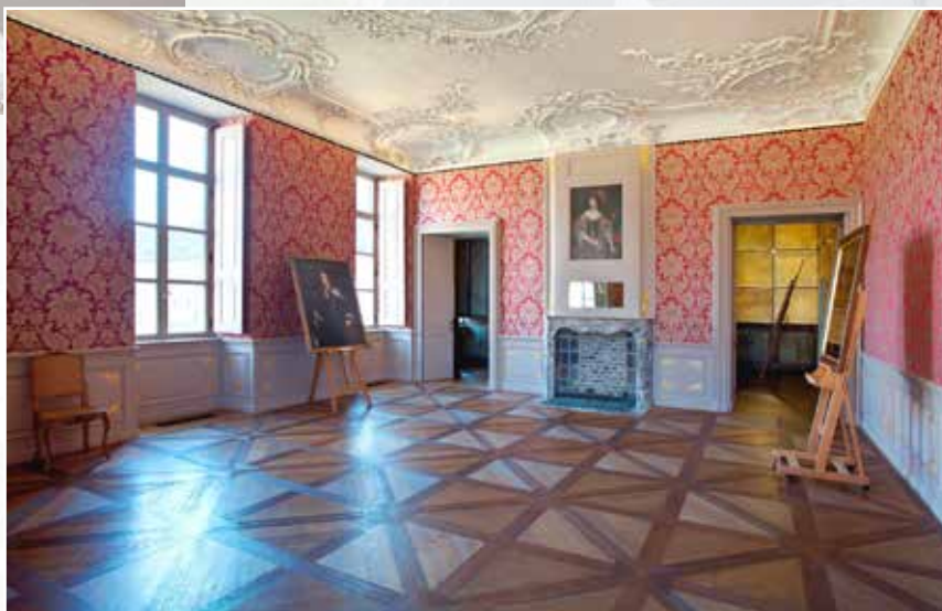
Appartement van de landcommandeur © J. van der Vaart.