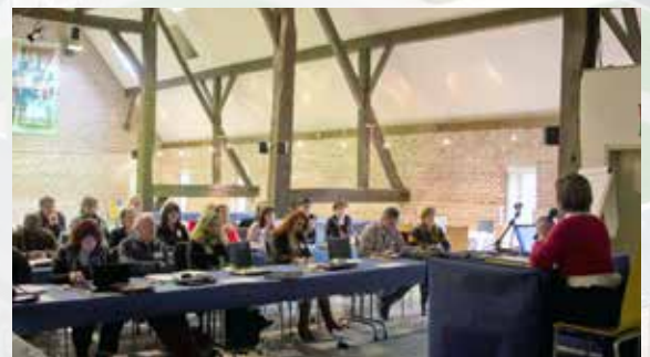
Meeting in zaal Cuvelier