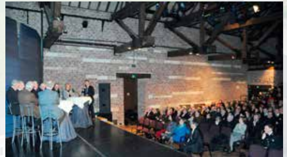
Conferentie in de Rijsschool

Bel hen nu op het nummer +32 (0)89 51 93 47/48 of mail via congrescentrumaldenbiesen@cjsm.vlaanderen.be of surf naar www.alden-biesen.be/nl/congres-kasteel