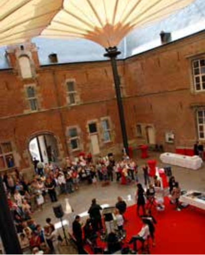
Evenement op Erekoer

Alden Biesen is één van de grootste kasteeldomeinen van de Euregio. De Landcommanderij, vroegere hoofdzetel van de Balije Biesen en residentie van de landcommandeurs, is nu een indrukwekkende erfgoedsite met een internationale uitstraling en tevens gastvrouw voor tal van evenementen.