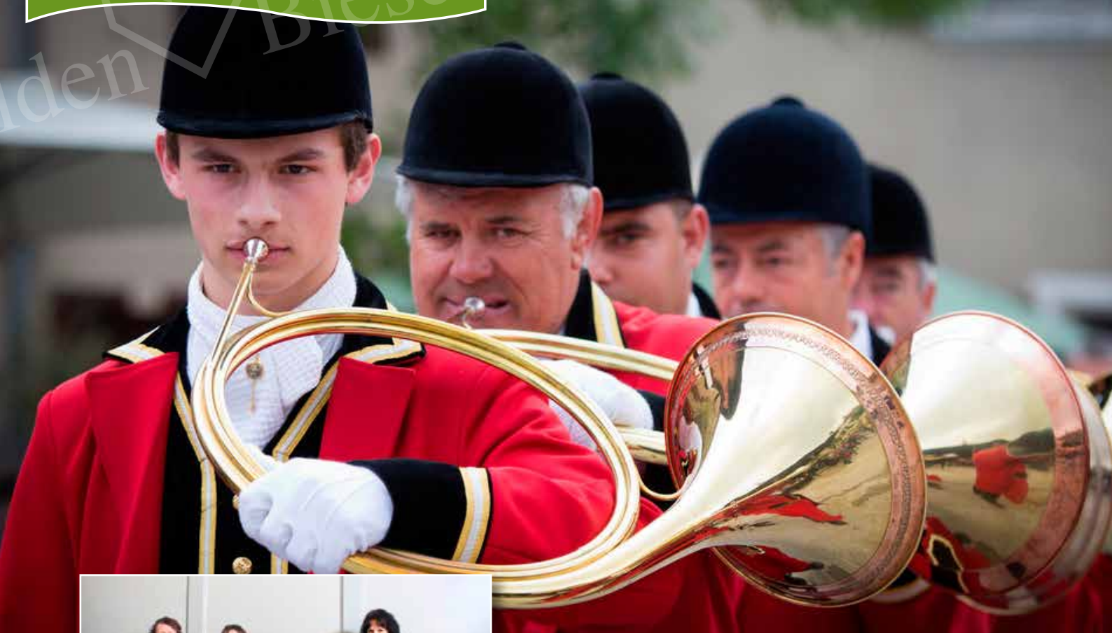
Jachthoornblazers 'La Vénerie' (BE)