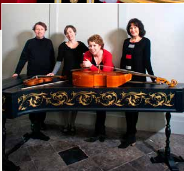
Ensemble Agimont (NL)