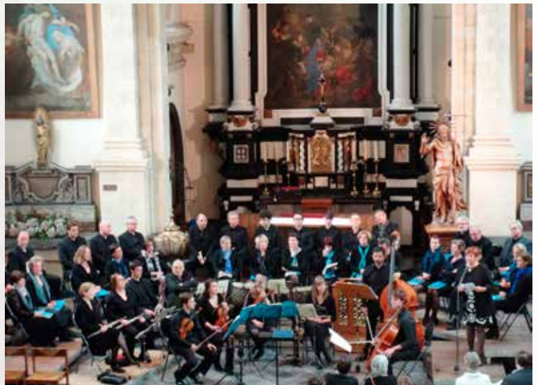
Bach Academie Alden Biesen

E | giovanni.saracino@cjsm.vlaanderen.be