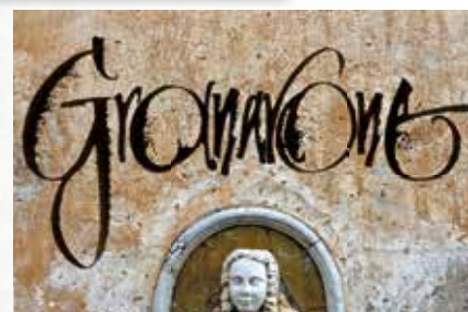
Granarone- kalligrafie Katharina Pieper (DE)