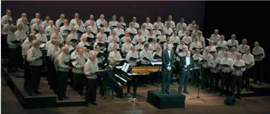
Kon. Zangver. Mastreechter Staar (NL)