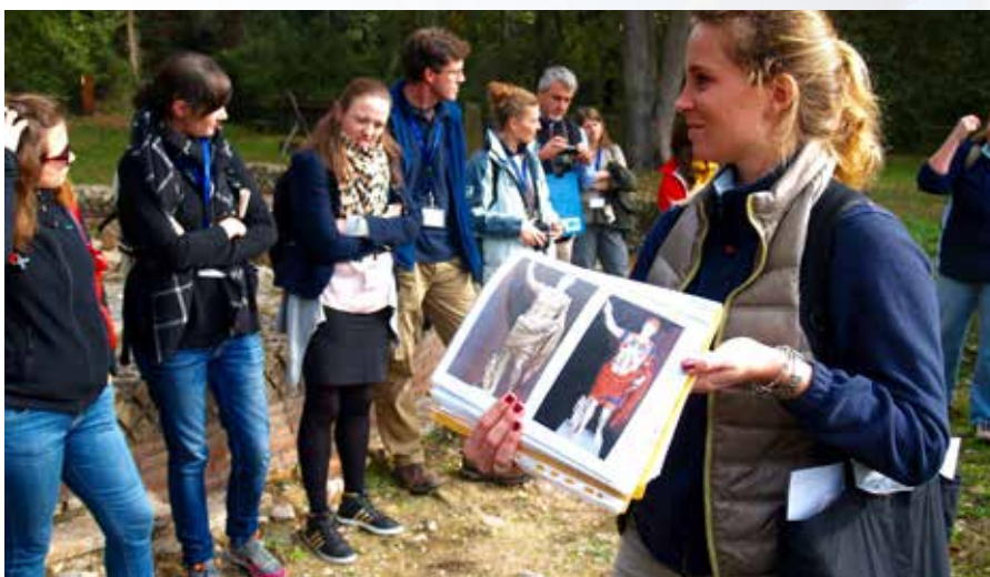
Bezoek aan Roman Villa Domiziano (IT)