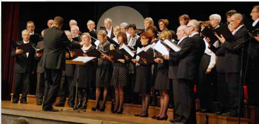
Zanggroep Aveland, Hoeselt

Kaarten zijn te verkrijgen of kunnen gereserveerd worden bij Etienne Thijs: T | 0478 065 681 of E | harmonierijkhoven@gmail.com