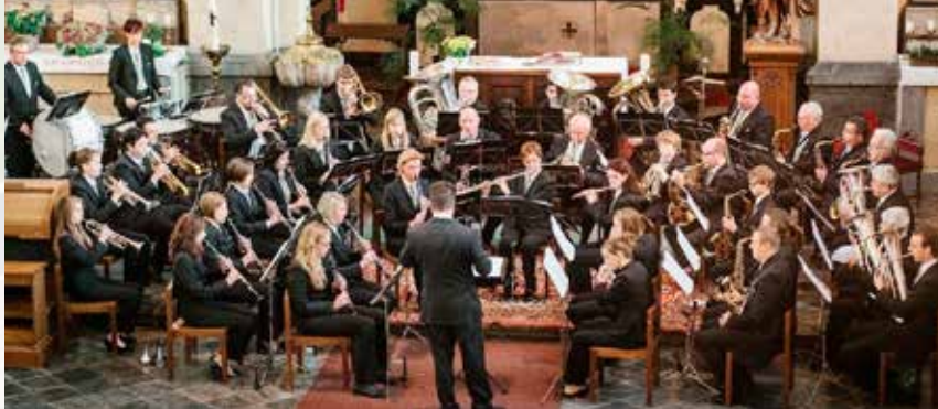
Kon. Harmonie St Isidorus, Rijkhoven