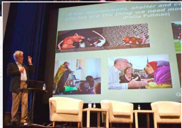
Tales slotconferentie in Beja. G. Tilkin - Narratieven als didactisch concept.