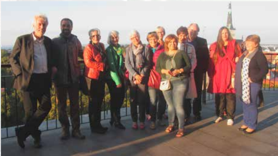
Het Tales-team in Tallinn (EE).

We worden omringd door verhalen. Verhalen wortelen in ons geheugen, in onze familiegeschiedenis, onze straat, stad of land. Verhalen ontstaan wanneer we vrienden, collega's en burens ontmoeten... Ze gaan over het dagelijkse leven, vreugde, verdriet, woede, angst of gewoon over ditjes en datjes. J.P. Sartre schreef in 'La Nausea': "De mens is een verhalenverteller, hij leeft omringd door zijn eigen verhalen en die van anderen, hij ziet alles wat hem overkomt via deze verhalen en hij tracht zijn leven te leven alsof hij het vertelt."