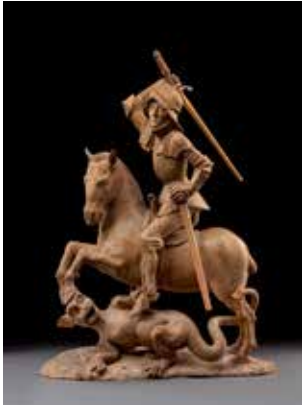
Sint-Joris door Tilman Riemenschneider

Lang moet je niet zoeken naar banden tussen Alden Biesen en andere culturele hotspots, ver of dichtbij.