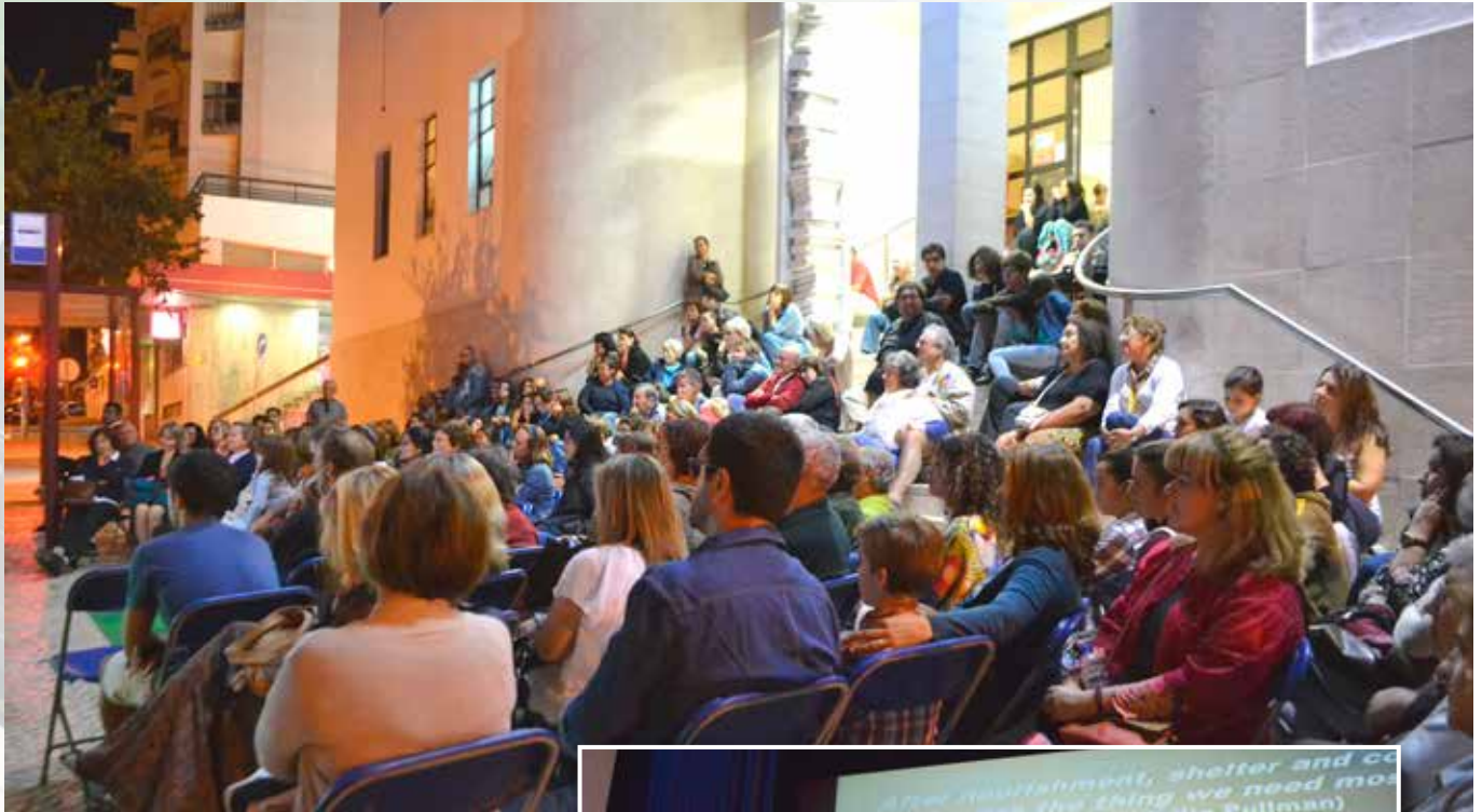
Tales slotconferentie in Beja (PT). 's Avonds luisteren naar verhalen op de trappen van de bibliotheek.

duceren vertelactiviteiten en verteltechnieken als een bindende factor om verschillende vormings- en socioculturele sectoren in een regio of gemeente te verenigen, dit in een gemeenschappelijke benadering voor samenwerking tot 'leren', tot gemeenschapsofbouw en voor inclusie van moeilijk bereikbare groepen. Er wordt getracht om dit te bereiken door het ontwikkelen van professionele competenties bij leerkrachten, docenten, sociale en culturele werkers en 'storytelling curatoren' en door het creëren van regionale en intersectoriële vertelnetwerken met Europese links.