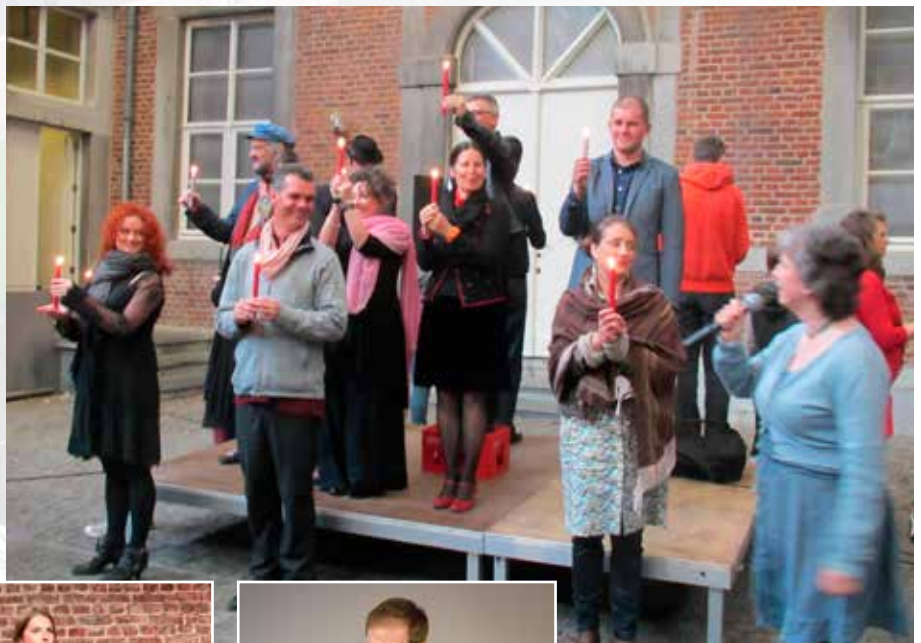
De levende taart

Om deze verjaardag te vieren, hadden wij een aantal initiatieven genomen maar bleek dat ook de vertellers niet hadden stilgezeten. Als een groep samenzweer-