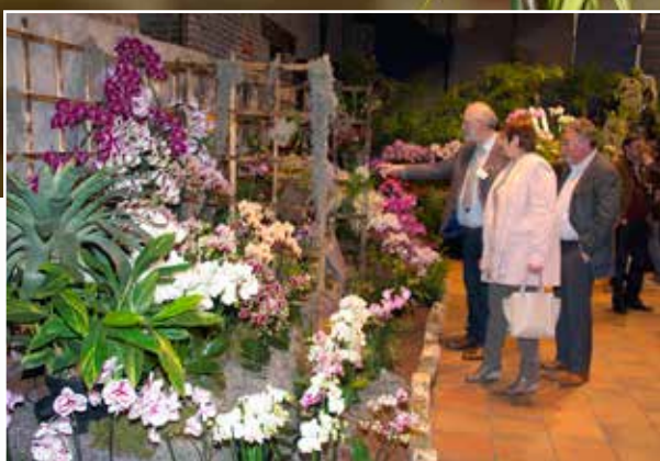
Opening Orchilim 2015