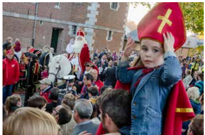
Intocht van de Sint op 2 november