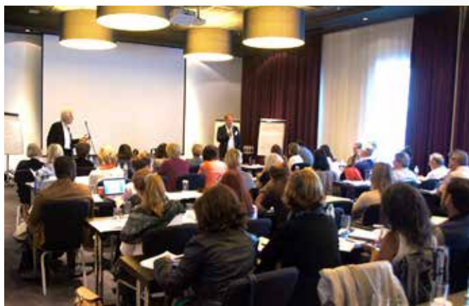
GINCO T&T slotconferentie in Leuven

Het GINCO T&T project is geëindigd en sluit een periode van 5 jaren af waarin Alden Biesen, als coördinator, samen met vele buitenlandse partners, gewerkt heeft aan kwaliteitszorg voor internationale cursussen. Het project eindigde met een internationale cursus in Alden Biesen, een internationale conferentie in Leuven en de presentatie van het handboek.