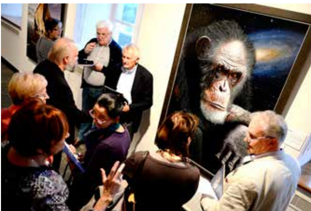
Opening TT Dreamscapes op 10 oktober