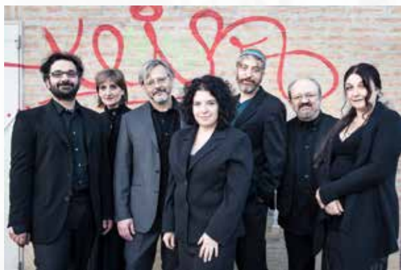
Ensemble Lucidarium (IT)

Na 30 jaar ruimt het eendaagse festival Dag Oude Muziek plaats voor AlbaNova . Het nieuwe format draagt de baseline 'Midzomerfestival voor creatie en muzikaal erfgoed' en slaat een brug tussen vroeger en nu. Op het programma staan eigentijdse creaties met het verleden als inspiratie, naast oude muziek die klinkt als nooit tevoren. De bezoeker geniet van een mix van historische concerten,