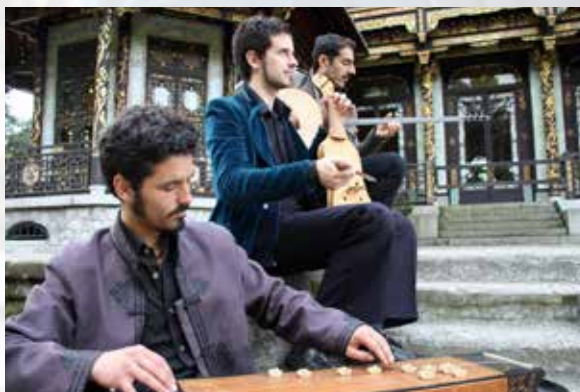
Ensemble Osuna (BE)