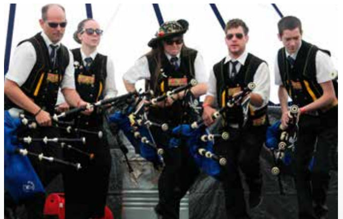
Bagad Brieg (UK)

open op zaterdag en zondag vanaf 9.00u. De teams voor animatie staan het hele weekend paraat voor groot en klein!