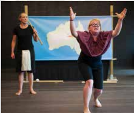
Theater Jejaaa (BE)

Eind januari - begin februari staat de telefoon roodgloeiend of krijgen we tal van enthousiaste mails als antwoord op het