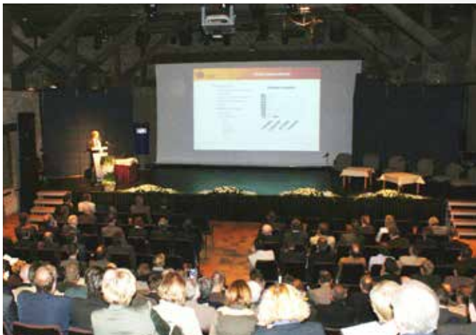
Congres in de Rijkschool.

Landcommanderij Alden Biesen geeft alle activiteiten van je bedrijf of organisatie een unieke uitstraling. Een congres, vergadering of meeting komt pas echt tot haar recht in deze historische setting, voorzien van de modernste, technische hulpmiddelen en centraal gelegen in de Euregio.