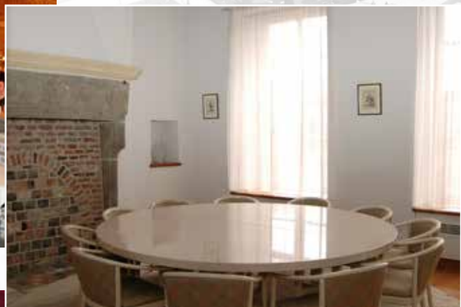
Vergaderzaal Wassenaer © K. Bollen.