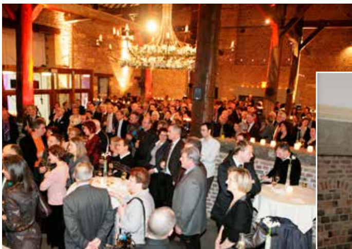
Jaarlijkse ontmoeting in de Tiendschuur.

De omgeving leent zich ook bijzonder goed om je vergaderingen of bedrijfsevenementen te combineren met een gidsbeurt of een sportieve uitstap. We bieden ondermeer een teambuildingactiviteit aan gecombineerd met historische informatie, je kan fietsen, witte wagentjes huren of bewegwijzerde wandelingen maken.