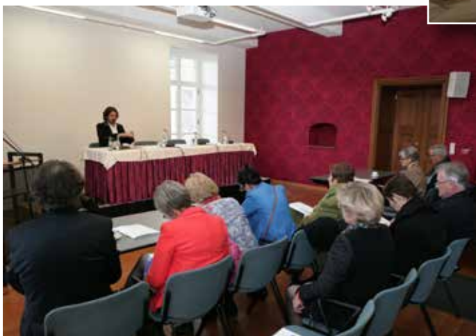
Persconferentie in zaal Bocholtz.

Heb jij een vraag hieromtrent of wil je zelf een evenement organiseren? Neem contact op en samen bespreken we de mogelijkheden!