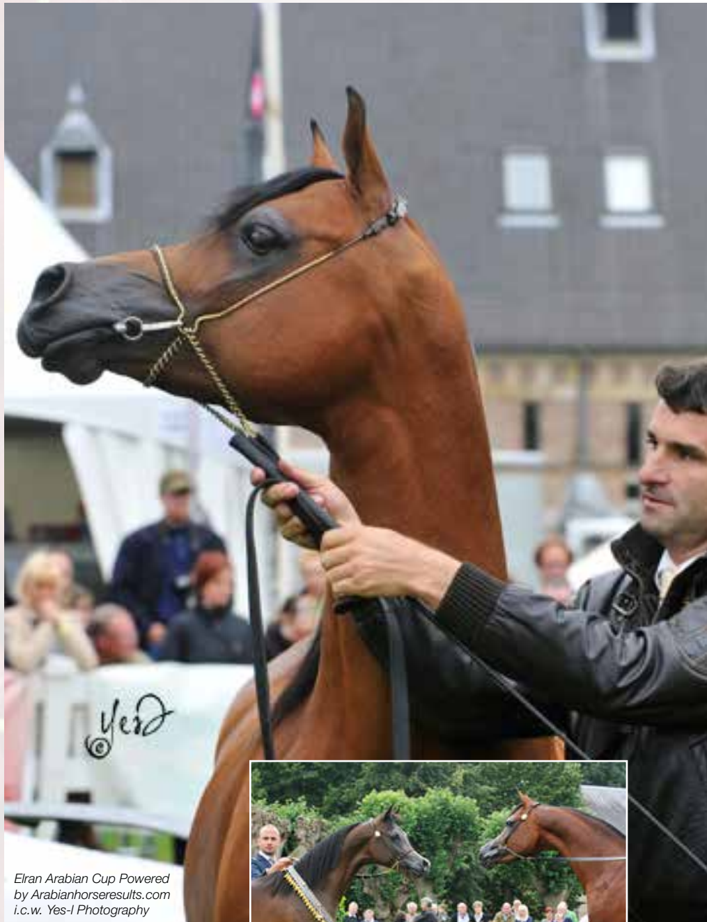
Elran Arabian Cup Powered by Arabianhorsesresults.com i.c.w. Yes-I Photography

De Arabian Horse Show is een van de belangrijkste paarden-shows in de regio en heeft Alden Biesen als vaste stek uitgekozen. Je vindt er de mooiste Arabische volbloeden met hun gevolg, tot Arabisch prinselijke bezoek toe. En natuurlijk heel wat andere vip's. Paarden-