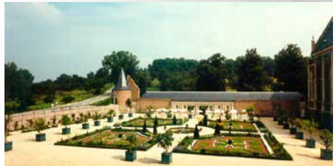
Zicht op de Oranjerietuin en de Hertenweide

Het reilen en zeilen in Alden Biesen is vanaf dit voorjaar ook op je TV-scherm te volgen. De Feratel-camera, die vroeger op de toren van het poortgebouw aan het einde van Maastrichterallee stond, is verplaatst naar het kasteel en biedt nu een beeld op de Franse tuin met de Oranjerie, het Buitenhof en een gedeelte van het Voorhof die je voortaan nauwgezet in het oog kan houden. Je kan ze natuurlijk ook via onze website www.alden-biesen.be bewonderen.