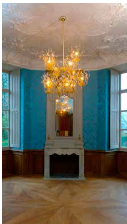
Het Blauwe Salon

Alden Biesen is de Poort tot het Kastelenlandschap Haspengouw en biedt de geïnteresseerde bezoeker een ruim gamma van gedocumenteerde wandeltochten: