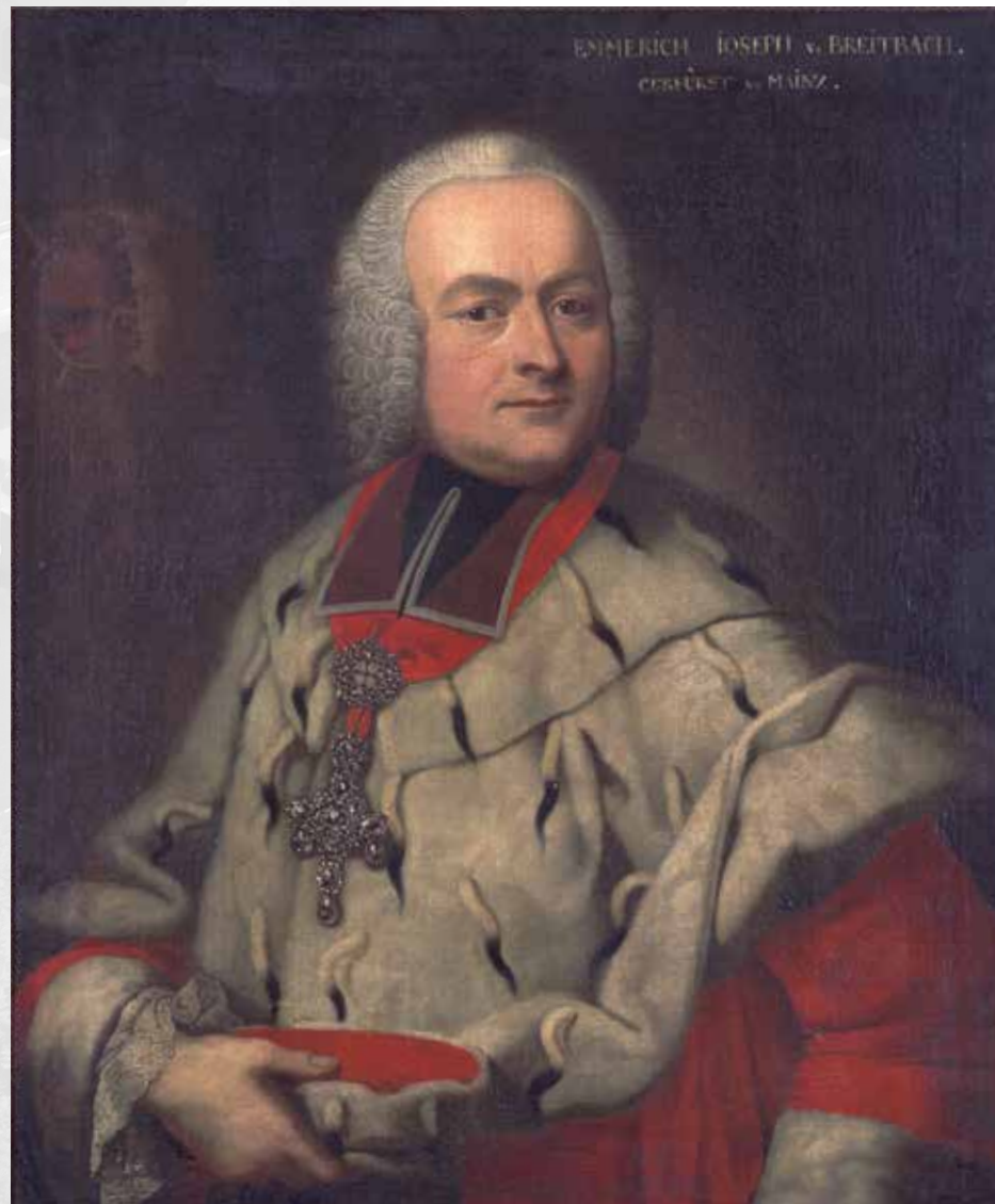
Emm. Joseph v. Breidbach

Het schilderij, dat bij het KMSK (Koninklijk Museum voor Schone Kunsten België) bekend staat als "Geestelijke keurvorst met de orde-tokens van de Duitse ridderorde", is een van de grootste werken in onze collectie. De herkomst bepalen ligt moeilijk, aangezien het noch met de geschiedenis van de Renaissance noch met onze streken een band lijkt te hebben. Het heeft, ondanks een vaardige schilderstijl en zijn monumentaliteit, ook geen bijzonder grote artistieke waarde. Het belang van het werk schuilt echter in de onrechtstreekse verbanden met de Duitse orde. De geportretteerde persoon is waarschijnlijk Emmerich Joseph von Breidbach zu Bürresheim. Van 1763 tot 1774 was hij aartsbisschop en keurvorst van Mainz. Tussen 1729 en 1809 bestond er echter een confraterniteit tussen de