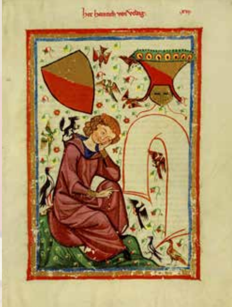
Herr Heinrich von Veldeke (Codex Manesse)

De 30ste editie van Dag Oude Muziek springt bijzonder in het oog. Na meer dan vijf jaar studiewerk, wekken de organisatoren de muzikale glorie van Hendrik van Veldeke en zijn tijd opnieuw tot leven. Van Veldeke is de eerste met naam bekende auteur in de Nederlandse taal.