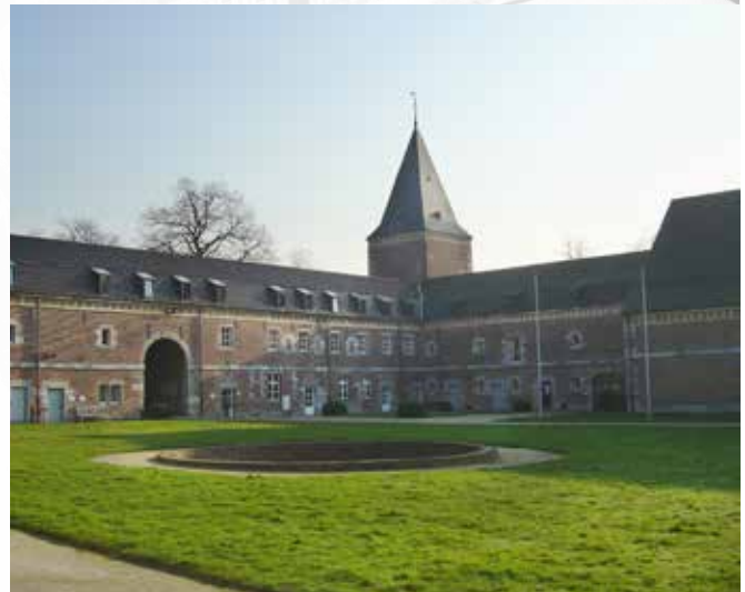
Zicht op het Buitenhofplein