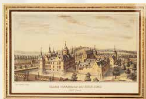
Cremetti - Grande Commanderie des vieux-jongs