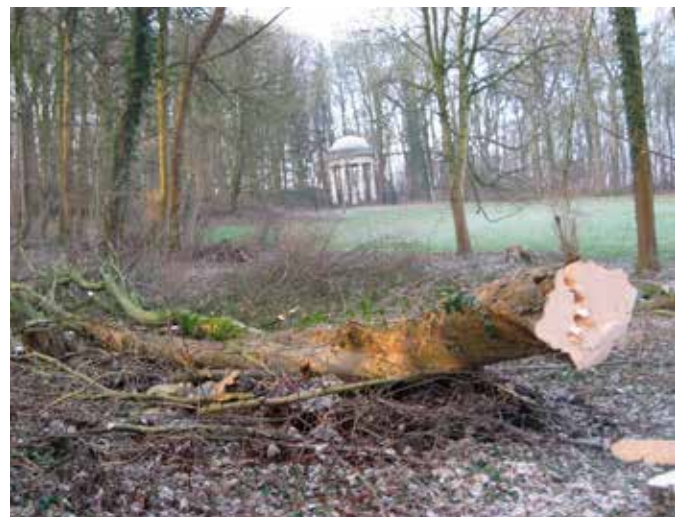
Kapwerken bomen in Engelse tuin.

Jasper Goffin: Niet echt. De oorspronkelijke tuin was aangelegd onder landcommandeur von Reischach vanaf 1786. Architect Henry, die ook tuinen in het nabijgelegen Zangerij (Eigenbilzen) en Duras tekende, stond in voor het ontwerp en de uitvoering. De tuin had alle kenmerken van de toen erg modieuze, Engelse tuinen: het open doorzicht met de typische 'bowling greens' of uitgestrekte graspartijen, de kronkelende paden, de rijke en afwis-