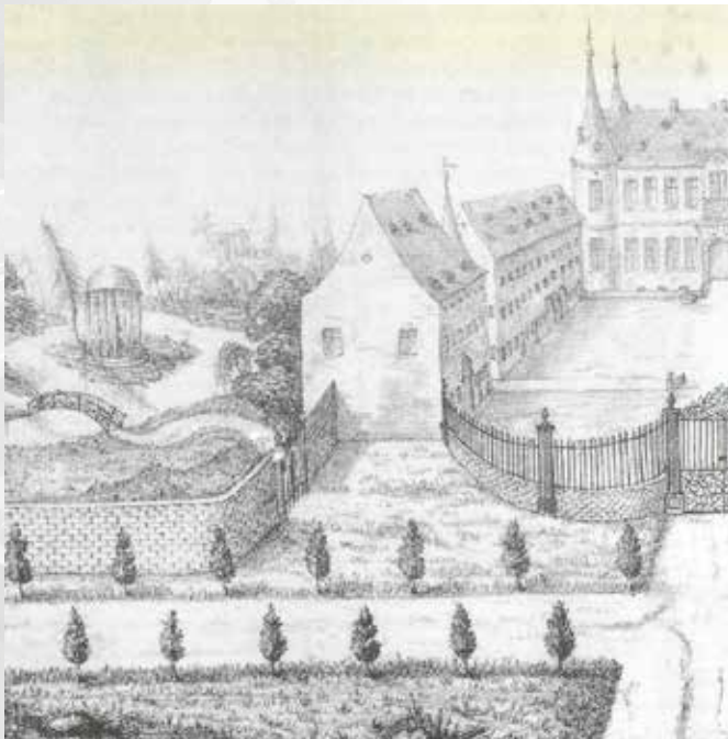
Tuingravure uit de lotterijaffiche met zicht op Alden Biesen vanuit het oosten, lithografie, Brussel, Jobard 1819.

Jasper Goffin: Het wordt vooral terug opbouwen. Zo worden het complex van de grot en de Griekse ruïne gerestaureerd, en krijgt ook het belvédère tegen de zuidmuur een opfrisbeurt. De grote rivier in het midden van de tuin, waarin op drie eilandjes de oorspronkelijke prieeltjes lagen, zal niet worden hersteld. De bodem is wegens de aanwezigheid van drijfzand te onstabiel. Dat ontdekte de Britse tuinarcheoloog Brian Brix ook al, enkele jaren ge-