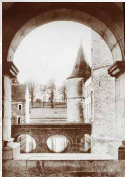
Oude postkaart, uitgeverij Thill, Brussel.

leden. Wel bijzonder is dat we de oorspronkelijke nutstuin in het noordoosten van de tuin, tegenover de Rijsschool gelegen, opnieuw gaan aanleggen. In de originele vorm waren hier een moestuin, serres, een 'ananashuis' en zelfs een kleine Oranjerie voorzien.